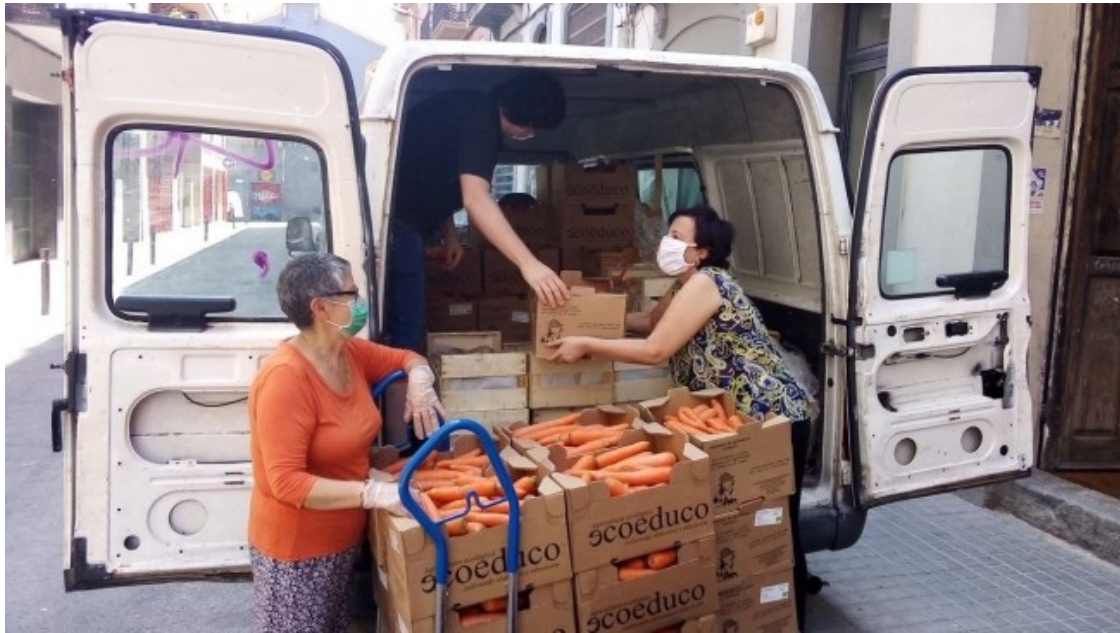
Repartiment d'aliments de la campanya #TotesATaula impulsada des de la cooperativa Opcions