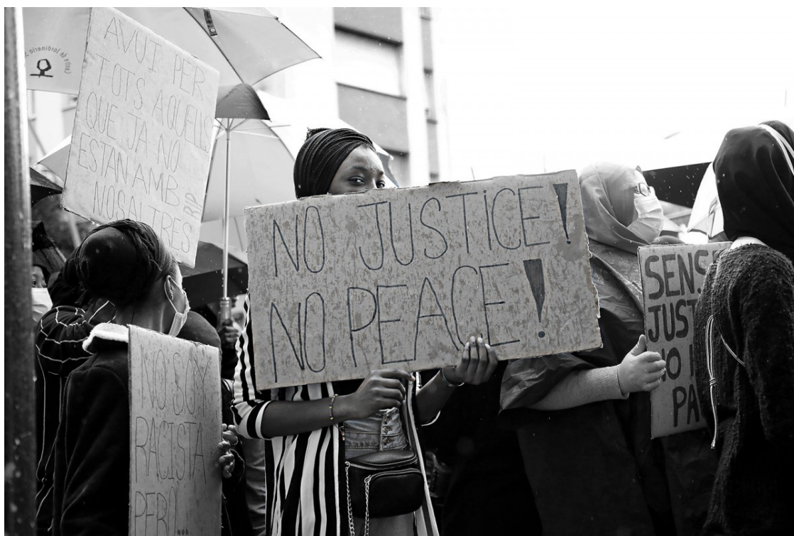
Manifestació del moviment #BlackLivesMatter a Salt | Aleix Auber

Selecció de 10 articles publicats aquest any a Setembre, sobre la Covid-19, però també l'emergència climàtica, la lluita antifeixista, l'economia solidària o la cultura com a salvaguarda i refugi