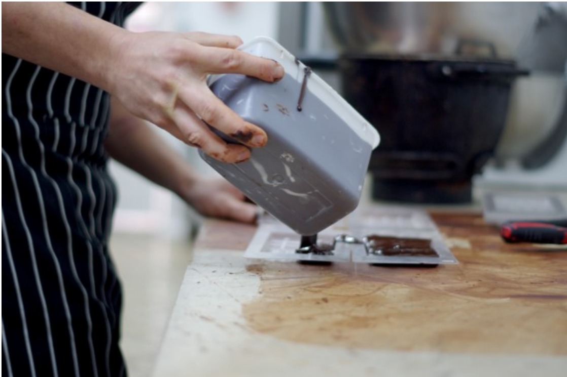
Riera preparant rajoles de xocolata a l'obrador