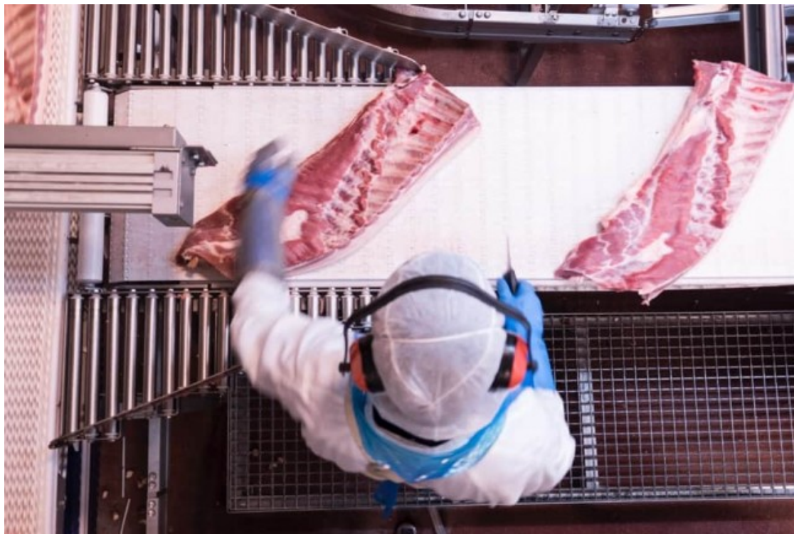
Un operari manipulant la carn a la planta de producció de Patel de Sant Martí Sescorts

La clau d'aquest creixement al llarg de 2019 cal buscar-la, segons el diari econòmic, en l'increment de la demanda de carn de porc procedent de la Xina, on un de cada quatre porcs està sent víctima d'un brot de pesta porcina. Pel que fa als beneficis, l'última dada disponible és la de 2018, amb un benefici net de 73 milions d'euros.