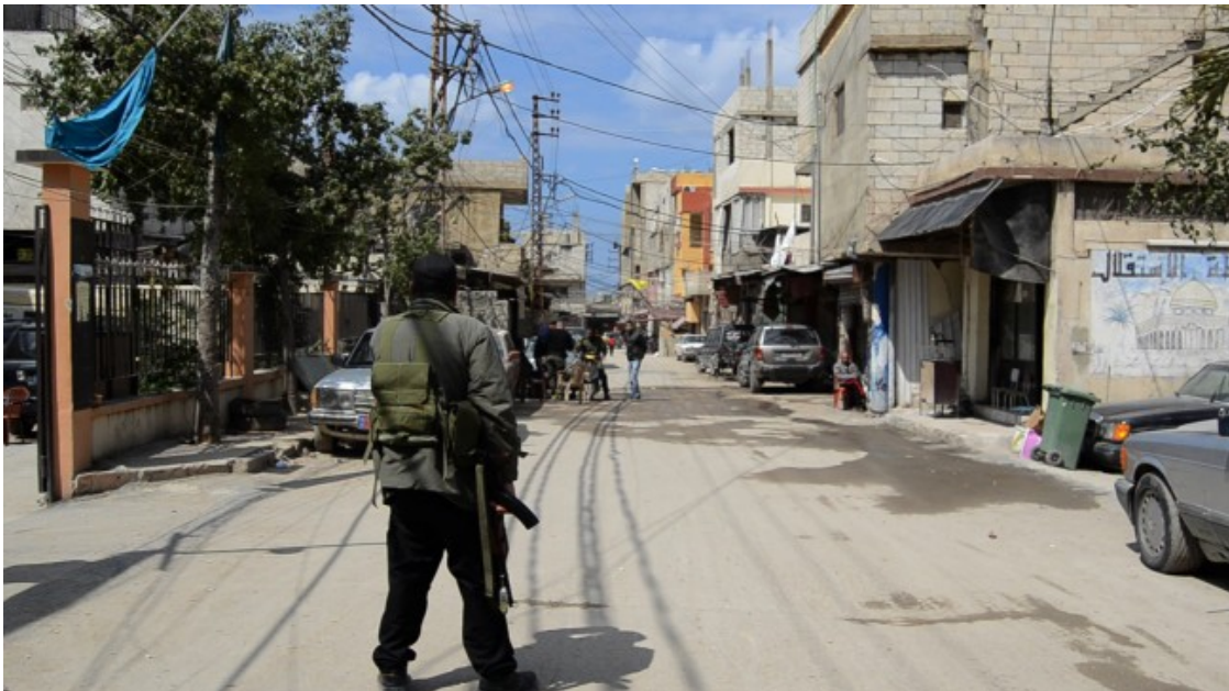
Homes armats al camp Ein El Hilweh