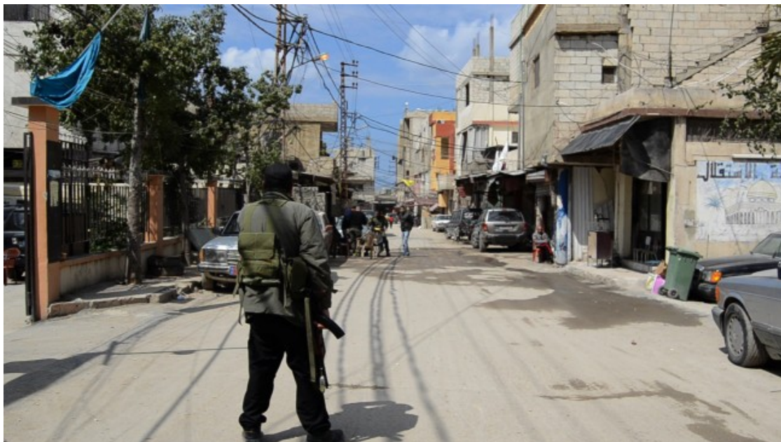
Homes armats al camp Ein El Hilweh