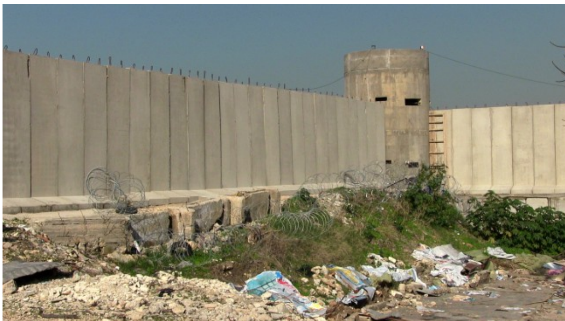
Nou mur en construcció a Ein El Hilweh