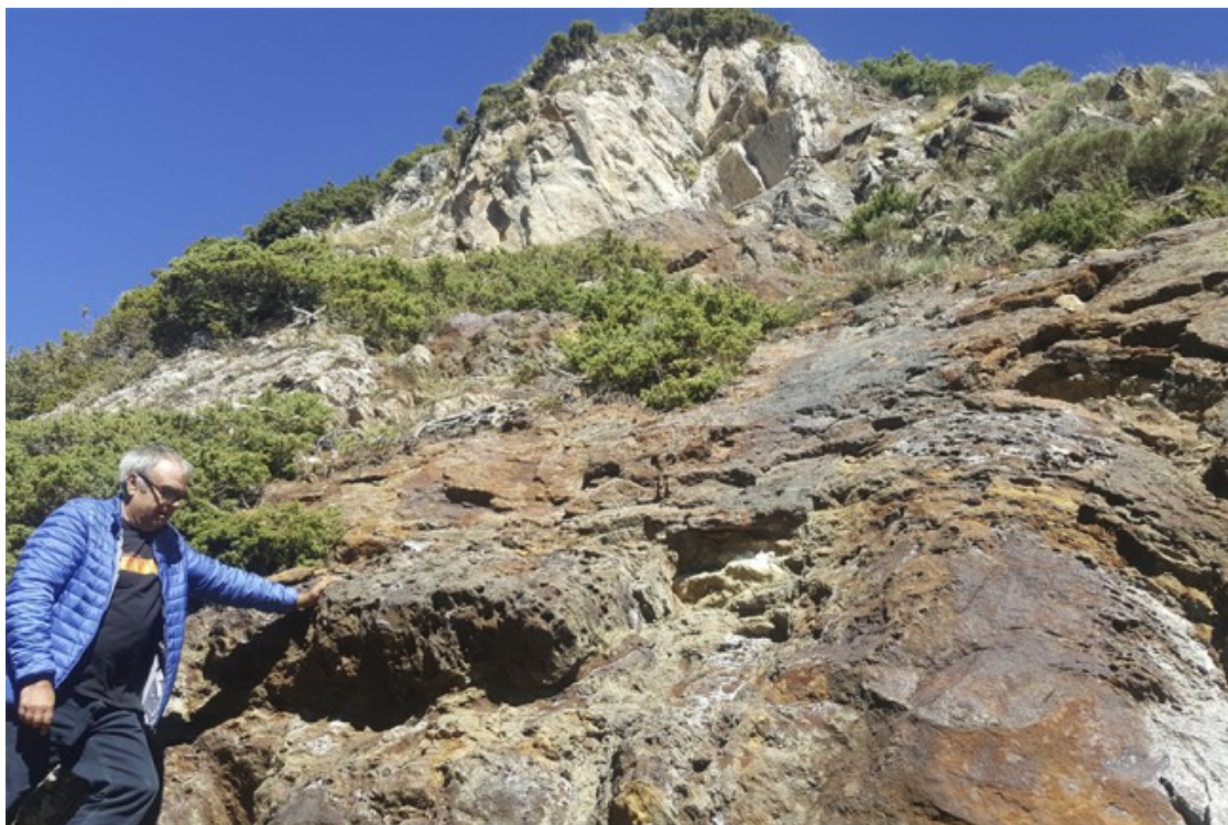
Un dels indrets on es perforaria la roca a la recerca de minerals

No és l'únic projecte miner que plana sobre aquestes contrades. Al Baix Pallars, Cobalt Rock S.L. vol obrir una mina de cobalt entre Peramea i Bretui, dintre del Geoparc de Conca de Tremp-Montsec. A la vall de Ribes, al Ripollès, es planegen noves prospeccions per cercar or en terrenys de municipis com Toses, Planols, Ribes de Freser, Campelles, Pardines i Queralbs. Per últim, als municipis empordanesos de La Vajol, Darnius i Maçanet de Cabrenys l'empresa Mineralia vol obrir de nou una antiga explotació d'extracció de talc. Rere l'oposició als tres projectes també hi ha la Societat Internacional de geologia i mineria pel desenvolupament i gestió del territori (SIGMADOT) i, en el cas del Pallars, l'Associació de Veïnes i Veïns del Baix Pallars, Lo Pedrís.