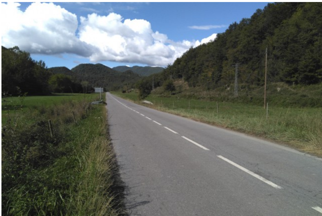
Plana al·luvial on s'ubicaria el nou polígon