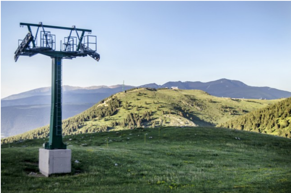
Imatge presa durant la construcció del telecadira Coll de Pal-La Molina