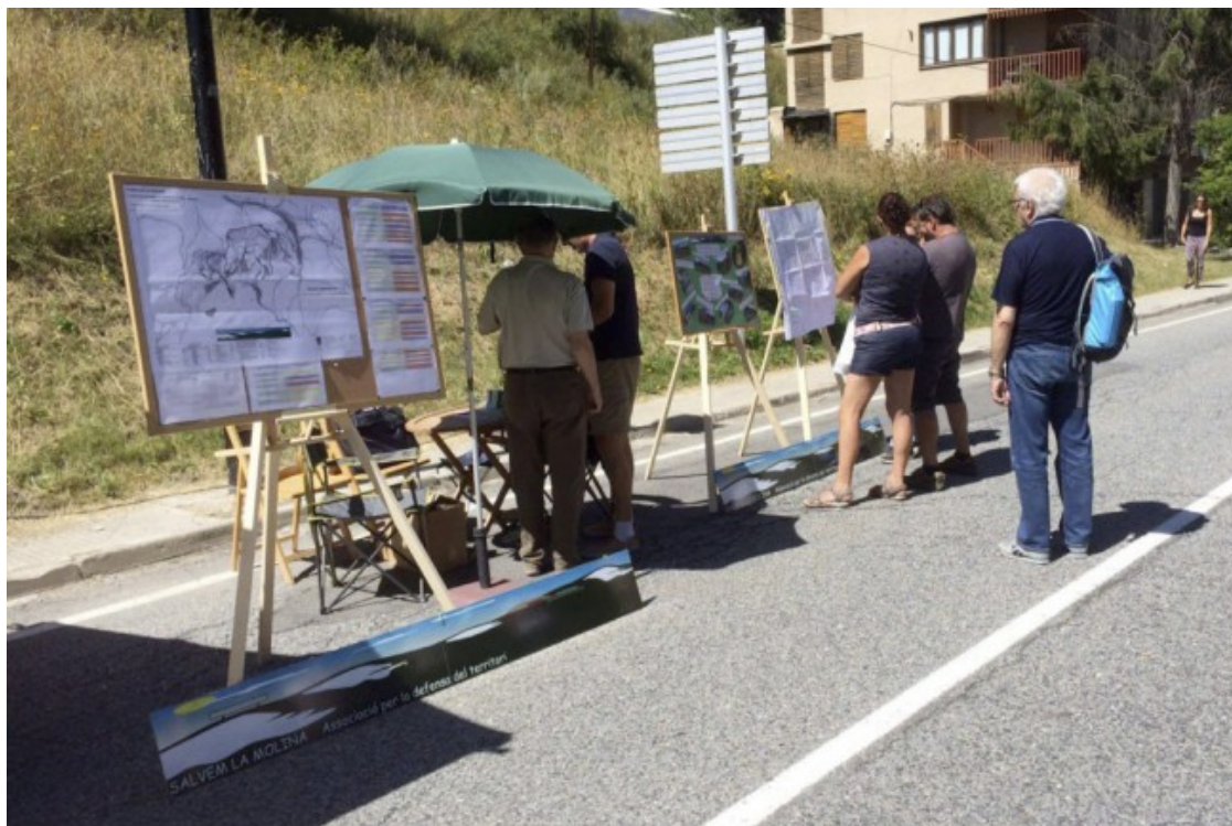
Punts informatius de Salvem la Molina durant el passat estiu