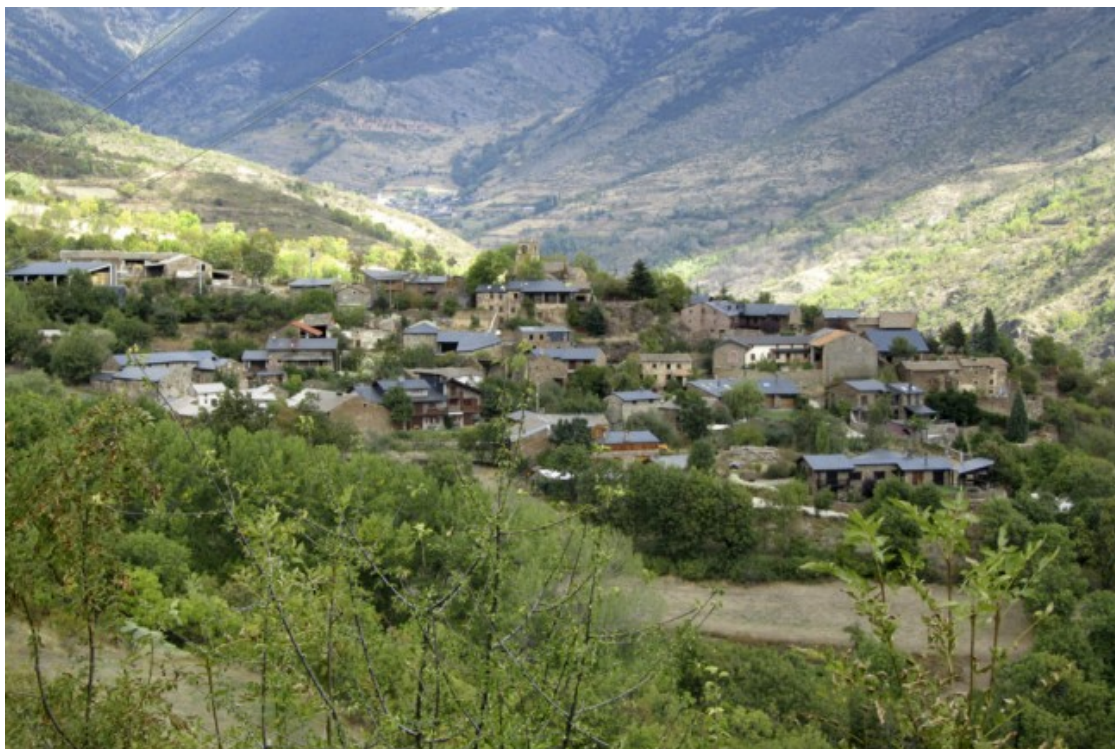
Vista paronàmica del poble d'Éller