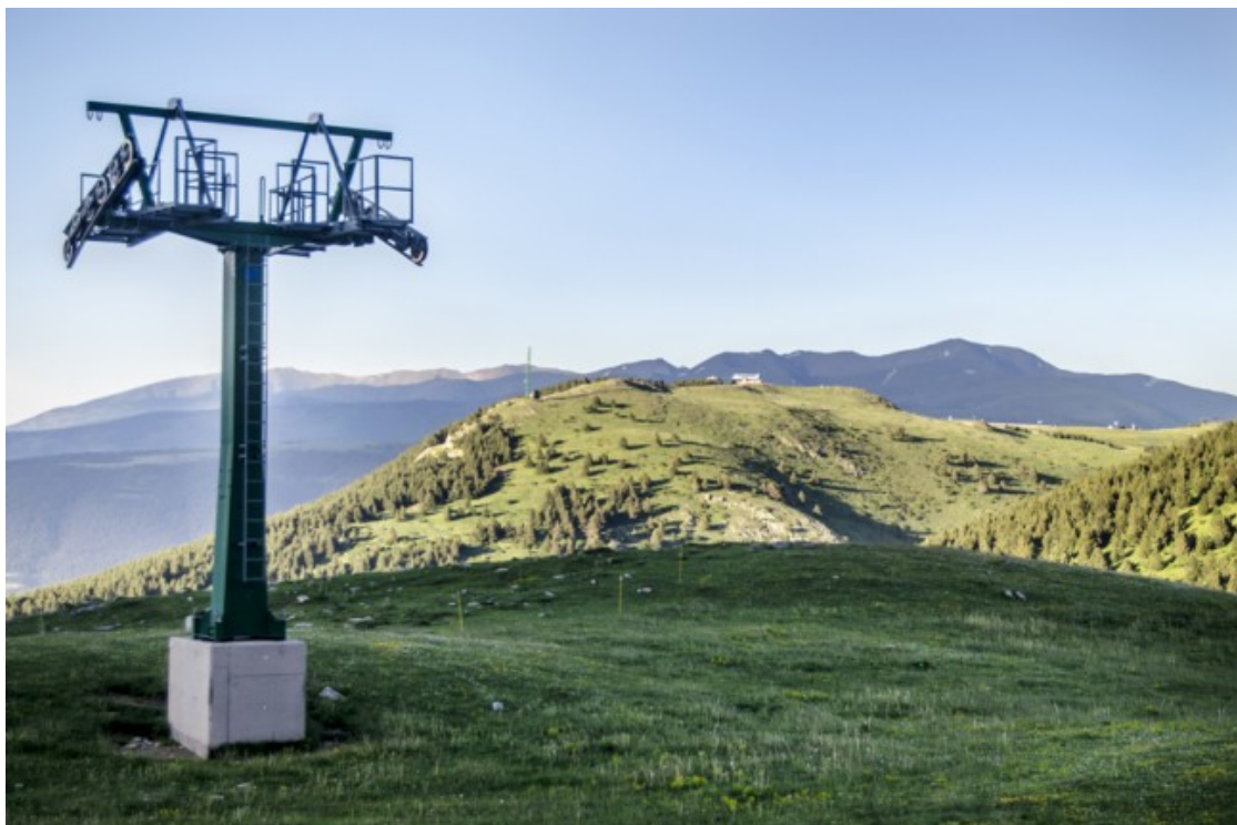
Imatge presa durant la construcció del telecadira Coll de Pal-La Molina