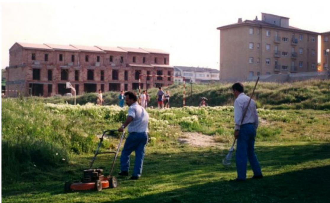
Veïns fent treballs de mantenim al camp de futbol que tenien en un camp al costat dels edificis