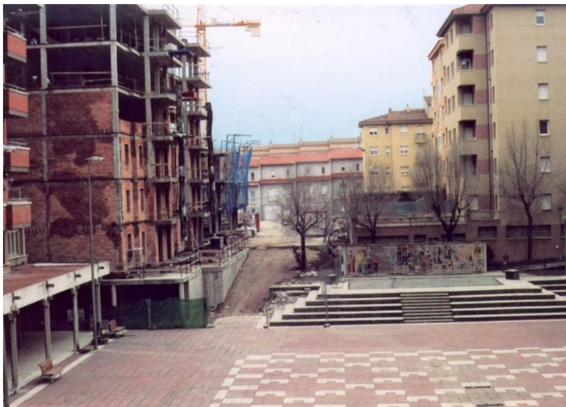
Construcció de la plaça d'Osona als anys setanta