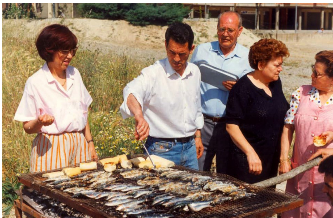
Sardinada veïnal al barri | Comunitat de propietaris de la plaça d'Osona