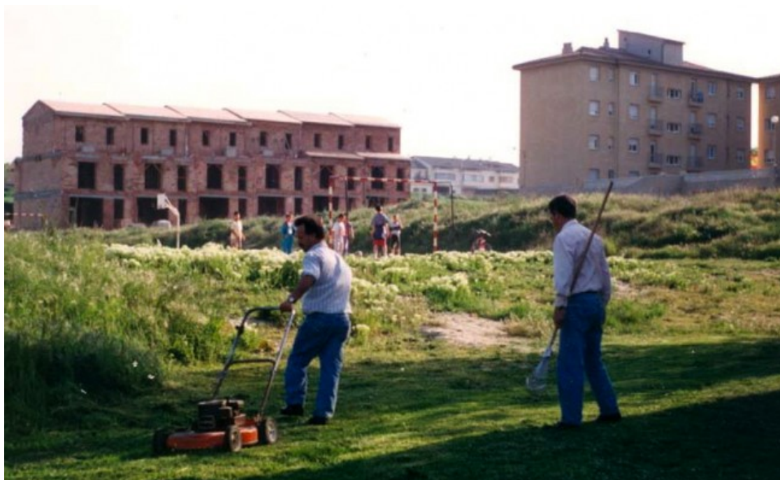
Veïns fent treballs de mantenim al camp de futbol que tenien en un camp al costat dels edificis