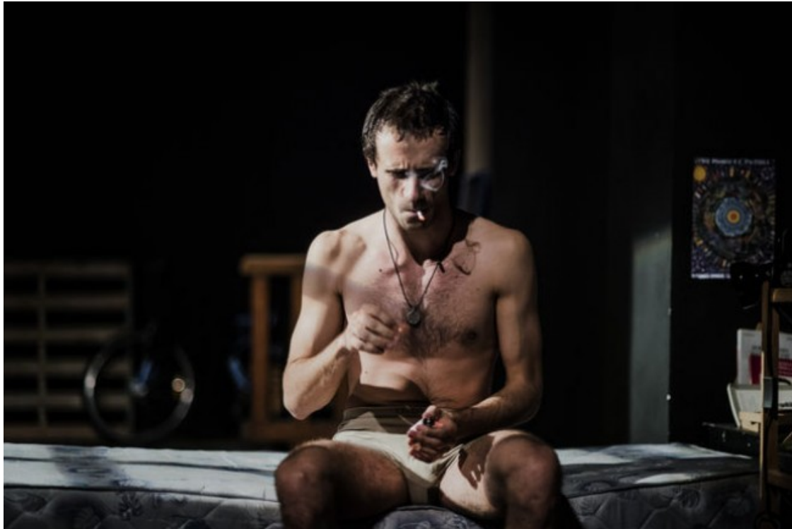
Un moment de l'obra Ragazzo, inspirada en la tràgica mort de Carlo Giuliani

Ragazzo, malgrat tot, viu l'estiu de la ciutat: fa poc ha okupat amb uns amics un espai acollidor que han condicionat com a vivenda, està de vacances, té temps per escoltar música, llegir, cuinar, enamorar-se? i per participar al Fòrum Social Mundial que també s'ha instal·lat a la ciutat i on més de mig milió de persones discuteixen com seria aquest "altre món possible" que des de fa uns anys s'imagina com a alternativa a la globalització. El seu destí quedarà marcat quan prengui la decisió de quedar-se a la Columna dels Desobedients, que s'ha proposat una acció pacífica de desobediència civil: violar el confinament de la 'Zona Rossa'.