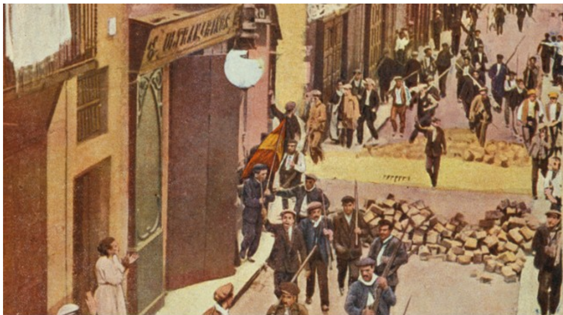
Il·lustració de l'assalt a la Caserna dels Veterans a 'La Actualidad', el 26 de juliol de 1910