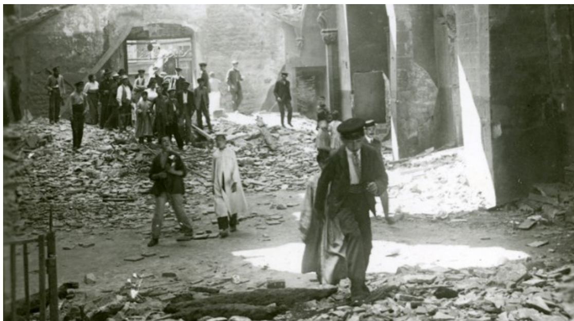
El convent de les Jerònimes després de la crema

S'aixequen barricades, hi ha enfrontaments violents entre els obrers i els militars, sobretot la Guàrdia Civil, i la vaga s'estén a altres localitats com Sabadell, Montblanc, Sant Feliu de Llobregat, Igualada, Alcoi, València, Valls, Palafrugell, Terrassa, Reus, Badalona, Granollers, Vilanova i la Geltrú, Mataró, Sitges, etcètera. Tot i així, és en alguns barris barcelonins com Poble Nou, Sants, Gràcia, les Corts o Drassanes on es produeixen els enfrontaments més violents i continuats. Al migdia, el govern declara l'estat de guerra amb l'oposició del governador civil Ossorio y Gallardo, que presenta la dimissió. Ràpidament, els vaguistes passen a atacar els edificis religiosos, que era on menys resistència podien trobar. Alhora, representaven el poder que volien combatre i que, igual que els demanava submissió, els enviava a morir escorxats a l'Àfrica per uns interessos econòmics d'una elit que tenia vincles de tot tipus amb l'Església.