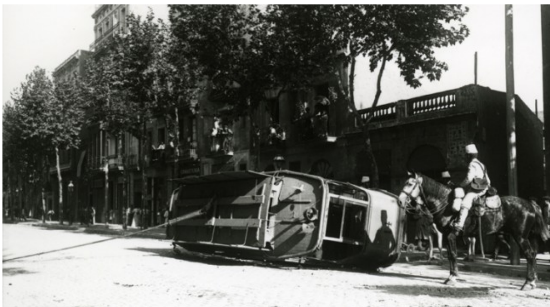
Soldat a cavall mirant un tramvia bolcat durant la Setmana Tràgica de 1909 a Barcelona

El 22 de juliol, el governador civil de Barcelona, Ángel Ossorio y Gallardo, prohibeix les manifestacions i incomunica Barcelona amb Madrid. El ministre de Governació, Juan de la Cierva, prohibeix els mítings i les manifestacions, alhora que ordena que es detingui tot aquell que protesti públicament. El dia 23, Solidaritat Obrera anuncia que declararà la vaga general contra la guerra el dilluns 26 de juliol. Malgrat l'anunci, la central obrera i llibertària no assumirà la direcció del moviment. Cal tenir en compte que, en aquell moment, arran d'una llei aprovada el 1855, es podia estar exempt del servei militar amb el pagament d'una indemnització de 1.500 pessetes de l'època. Si es pagaven, una altra persona ocupava la plaça del soldat cridat a quintes. Les 1.500 pessetes suposaven un salari complet d'un obrer de l'època, per la qual cosa anar a morir a la guerra esdevenia una qüestió de classe.