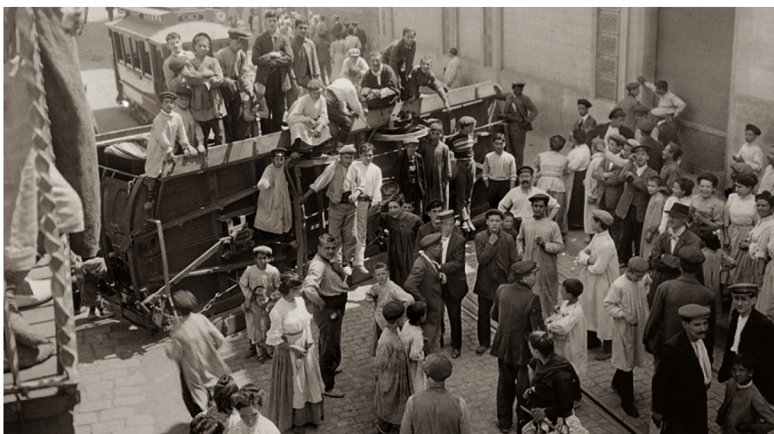
Barricada amb un tramvia bolcat durant les primeres hores de la revolta al barri de Gràcia de Barcelona

En el centenari de la Setmana Tràgica, recuperem aquest article de Jordi Martí Font sobre la revolta ocorreguda entre el 26 de juliol i el 2 d'agost de 1909 | «Què va passar a Barcelona ara fa cent anys? Què va abocar les masses de gent a cremar escoles religioses, esglésies i convents?»