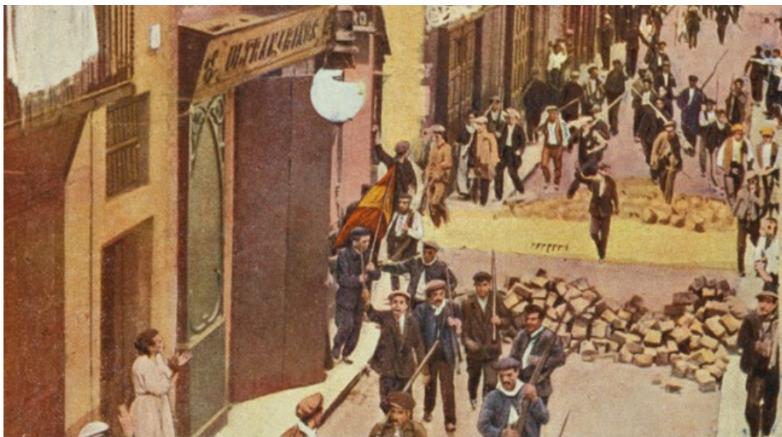
Il·lustració de l'assalt a la Caserna dels Veterans a 'La Actualidad', el 26 de juliol de 1910