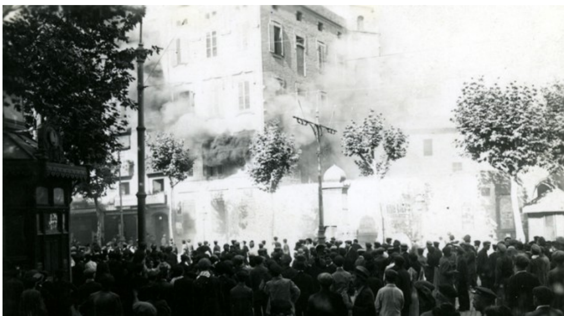
L'incendi dels Escolapis al barri de Sant Antoni de Barcelona