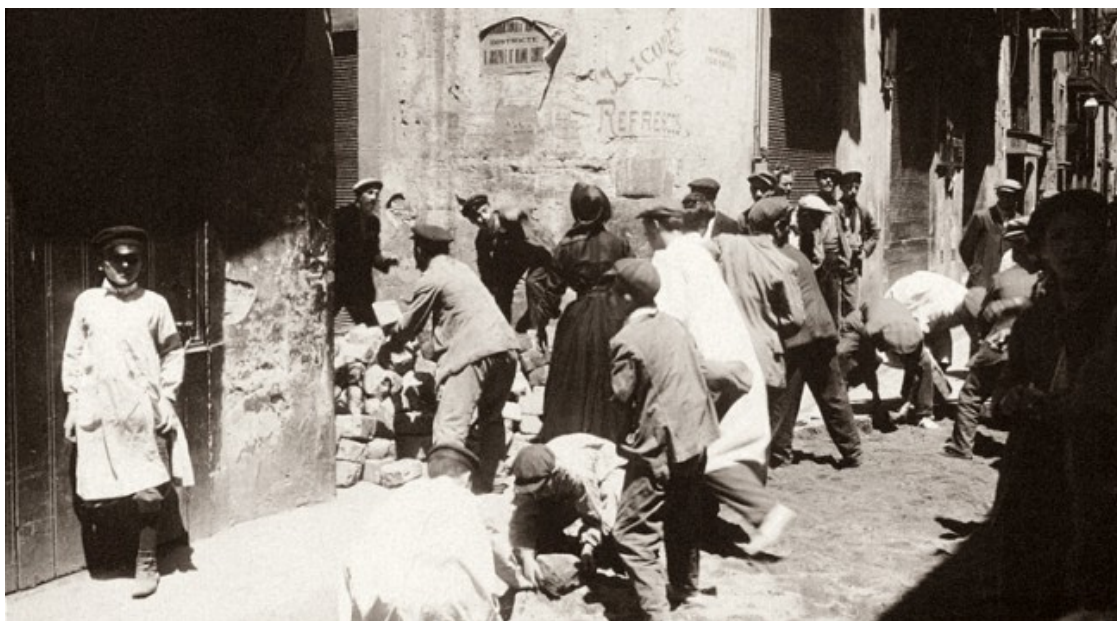
Dones, homes i nens van participar en la construcció de barricades durant la Setmana Tràgica a Barcelona

El darrer dia de revolta, que no de revolució, Pere Coromines explica que algunes de les històries que la gent conta i que ell ha presenciats són pures invencions perquè ell sap la veritat, pel que no s'acaba de creure molts dels relats que la gent li fa de coses que no pot constatar. Coromines conclou que «tots aquests dies m'he pogut fer una idea de com la por i la vanaglòria activen la invenció de l'home. Un urbano em deia l'altra matinada que a la Rambla els soldats marxaven per sota els balcons apuntant enlaire i jo, que vaig passar-hi al cap de pocs minuts, no hi vaig veure ni un soldat ni un guàrdia civil. (...) Es veu que d'aquí a una setmana les llegendes més fantàstiques seran contades amb el mateix aplom que si fossin veritat».