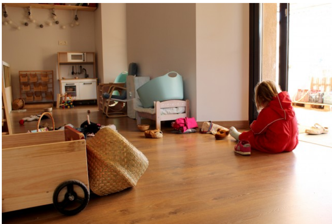
L'aula dels Capgrossos, els infants d'un a dos anys de l'escola Riu Sora

Un dels objectius de Locher era repoblar Sora i omplir-lo de famílies, és a dir, que el municipi deixés de ser un poble residencial. I ho va aconseguir: entre 2015 i 2017 van arribar al poble 21 persones i, en tres anys, es va passar de 184 habitants a 205. Així és com, el 2016, l'escola Riu es va instal·lar al nou edifici de tres plantes de l'Ajuntament, construït aquell mateix any a l'antiga rectoria de l'Església de Sant Pere, al voltant de la qual es troba el nucli del poble. L'escola n'ocupa la primera planta i una part de la segona, on hi ha una sala polivalent. Pel que fa a l'antic edifici de l'Ajuntament, es va destinar a pisos per a joves a preus assequibles. Segons Garcés, a banda de ser un espai accessible i envoltat de natura, es van donar unes condicions que van ser «molt perfectes». «El que va fer que vinguéssim aquí és que l'Ajuntament ens va acollir molt bé. Ens va posar moltes facilitats i s'hi ha creat una simbiosi molt bona perquè l'escola ha estat un motor per al poble: s'ha omplert de vida diària», afirma en Gerard.