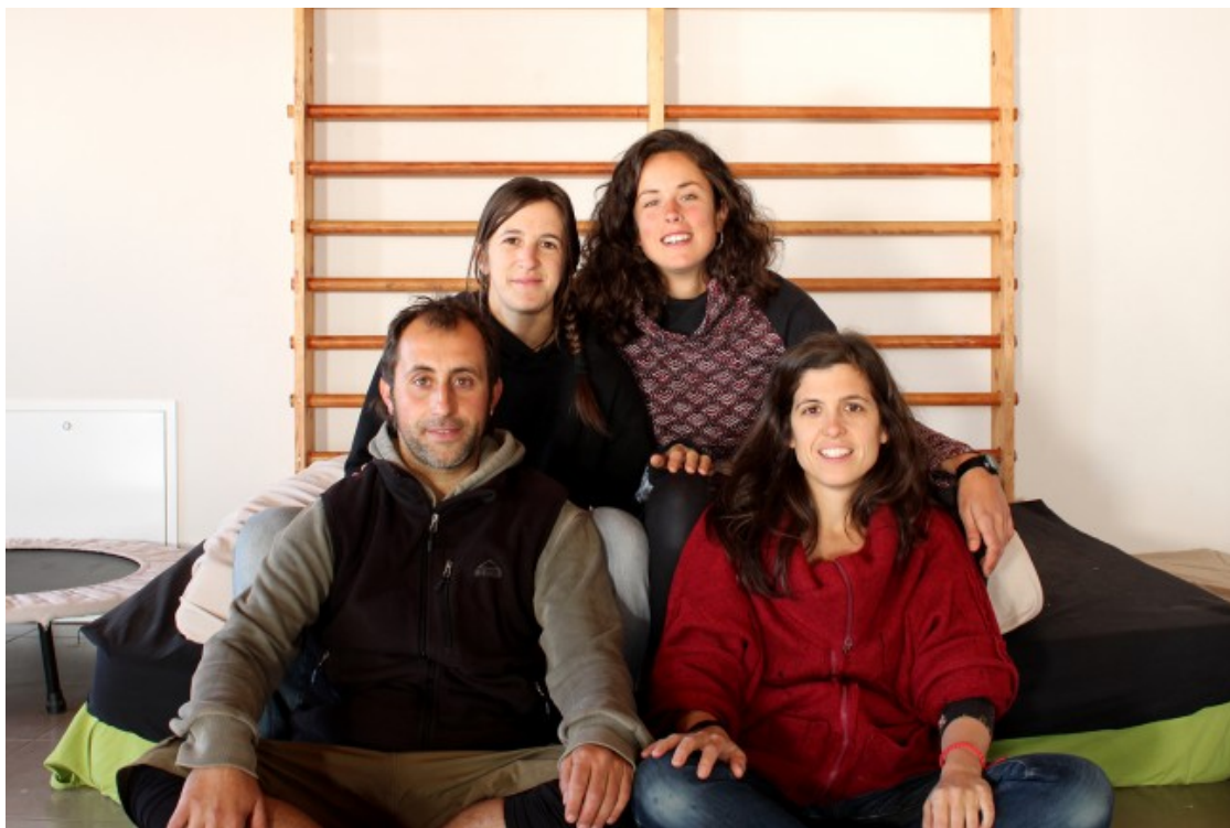
Els quatre acompanyants i socis treballadors de la Llera a la sala polivalent de l'escola, a l'edifici de l'Ajuntament

Actualment, a l'escola hi ha tres grups de nens i nenes: els Capgrossos, d'un a dos anys; les Truites, de tres a cinc i les Serps, a partir de sis. «Hi ha uns espais preparats amb materials que fomenten que l'infant pugui desplegar el seu potencial i les seves necessitats autèntiques», explica en Gerard. Per als grups de més de tres anys hi ha una proposta diària com, per exemple, un taller, i els infants decideixen si hi participen o no: «En realitat participen a totes les propostes perquè els entusiasmen bastant». Quant al grup dels més grans, les Serps, fan activitats molt relacionades amb el currículum de primària, «però la diferència és que tenen els materials a disposició, i l'aprenentatge i els interessos venen donats pel ritme de cadascú. Tenen diverses propostes i ells trien les que més s'ajusten a les seves necessitats». Segons Garcés, és molt estrany que un infant no vulgui fer res: «És molt utòpic pensar que no fan res, ja que fan moltes coses i en molts moments. Depèn dels ulls que miren: aquí jugar és l'aprenentatge més gran». Una de les principals característiques del model d'escola lliure és la manera de concebre l'acompanyament dels infants: «Posem l'infant al centre. Busquem respectar al màxim el seu desenvolupament i, a nivell pedagògic, també bevem de diverses influències que ens fan més peculiars i diferents», afirma en Gerard.