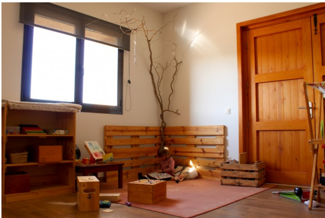
Aula de les Truites, el grup d'infants de tres a cinc anys del projecte Riu Sora

Una altra de les diferències entre el model d'educació lliure i el model d'educació formal és que les ràtios són molt més baixes i això fa que, segons Garcés, els vincles i les formes de relacionar-se siguin diferents: «Hi ha la part d'acompanyar l'infant no només en l'aprenentatge sinó també en la vessant més emocional, a través del vincle».