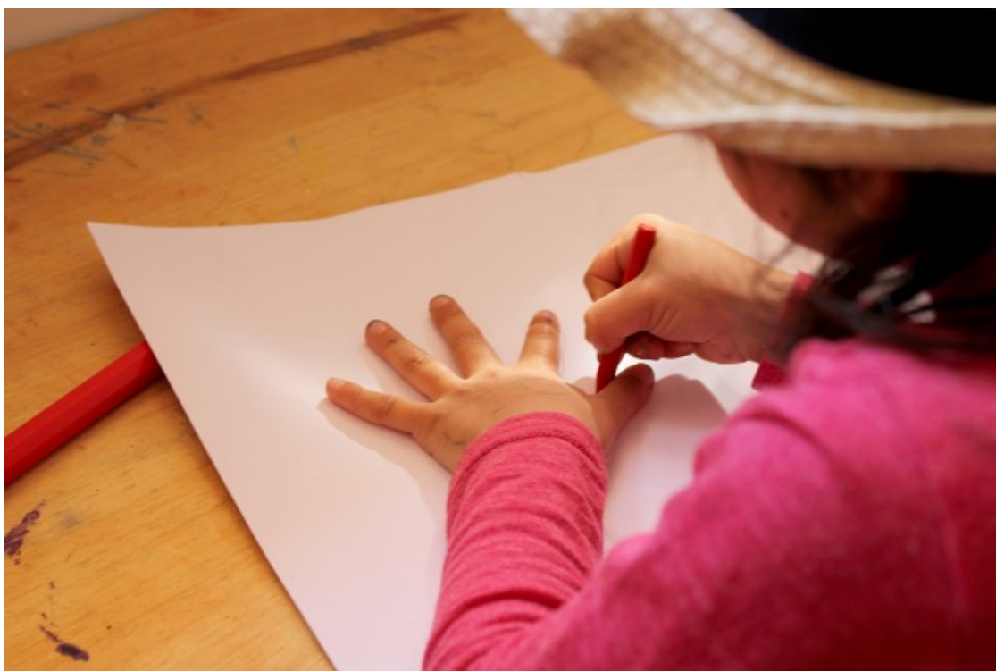
Una de les nenes del grup de les Truites de l'escola Riu Sora

El curs que ve, l'escola pren el nom de la cooperativa: «El concepte Riu s'acaba perquè tenir dos Rius creava una mica de confusió: Riu Sora serà La Llera i Riu Vic serà L'Erol». D'aquesta manera, es consoliden com a projectes diferents, amb models de gestió i funcionament independents. Quant a plans de futur, hi ha la construcció d'una escola de primària amb bioconstrucció, «respectuosa amb la natura i l'entorn, i amb el mateix model d'escola viva i lliure que tenim ara».