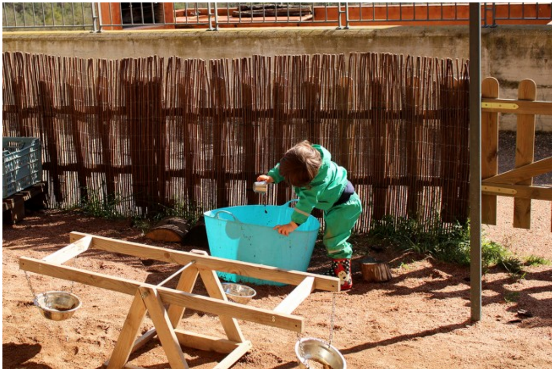
Un dels infants de Riu juga al pati de l'escola