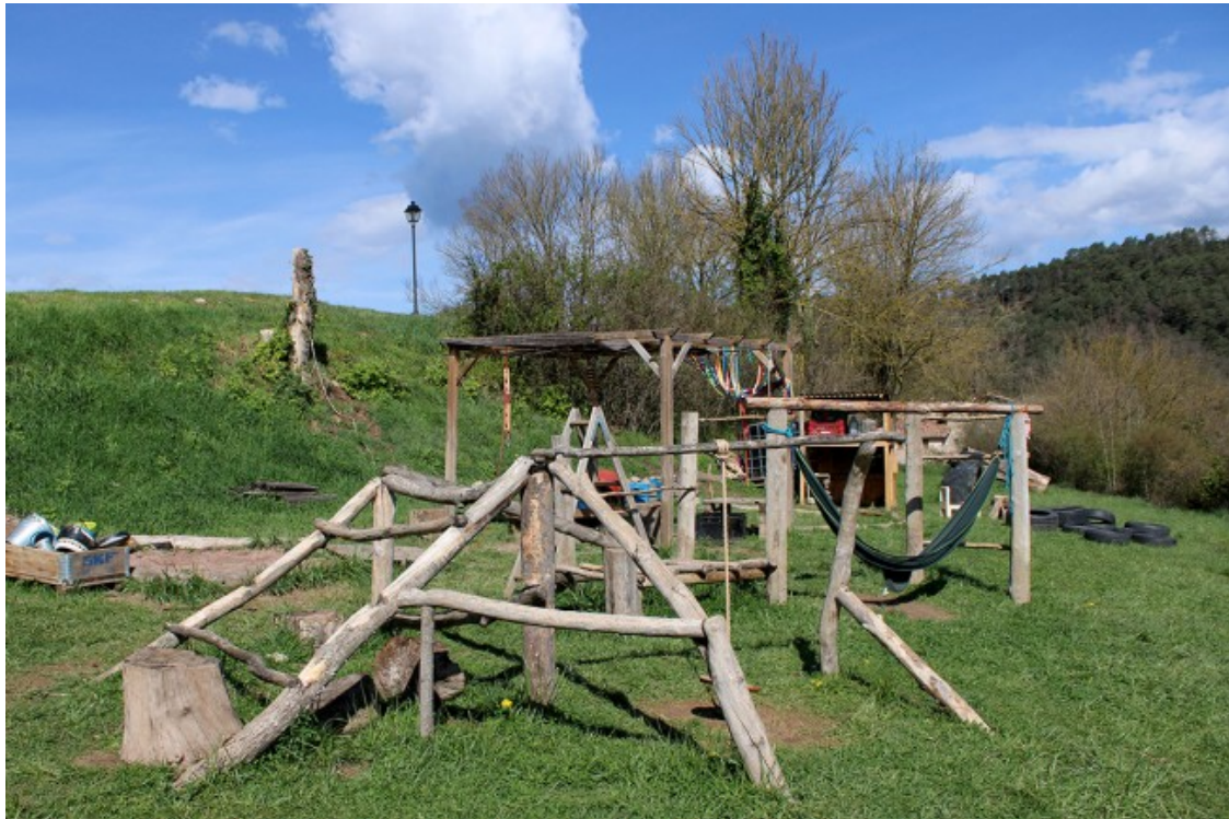
Exteriors del projecte d'educació viva i lliure Riu Sora