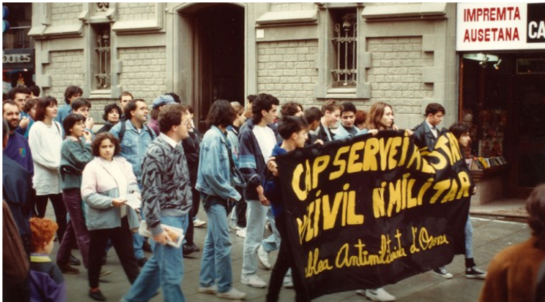
Dos moments més d'una de les manifestacions de l'Assemblea Antimilitarista d'Osona a Vic