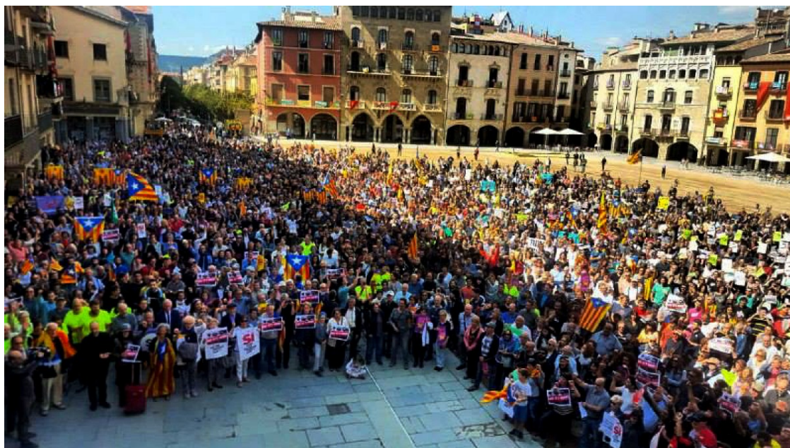
Concentració en defensa del referèndum i contra la repressió de l'Estat a Vic