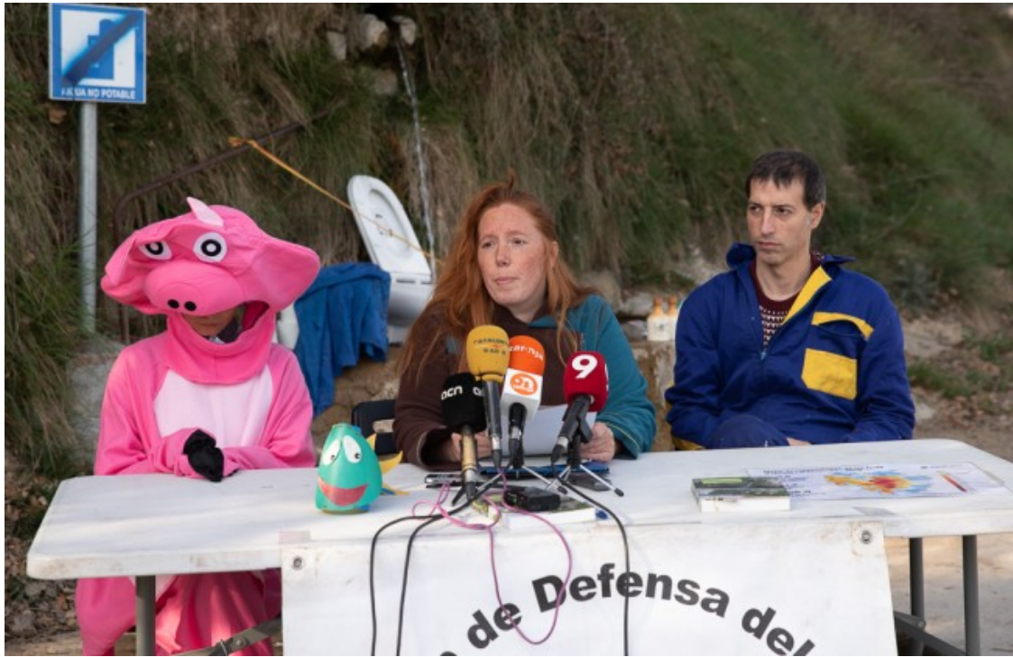
Presentació dels resultats de les analítiques del GDT, a la font de les Nogueres a Sant Vicenç de Torelló