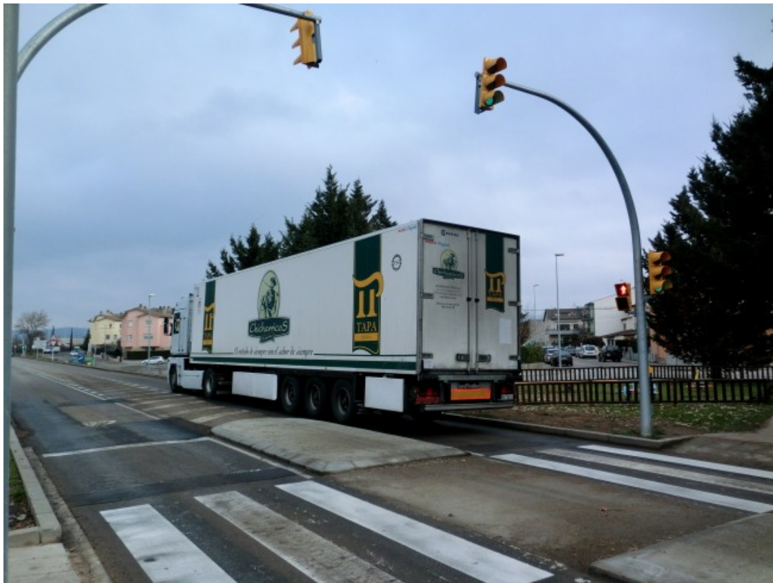
Un camió dels Chicharricos d'Aperitivos Tapa de Guadalajara circulant aquest dijous pel carrer Bon Aire de la variant de Calldetenes

Encara podria haver-hi altres alternatives, gens recomanables per camions de gran tonatge, i menys de nit i venint de travessar mitja Europa, però que no molestarien veïns pel soroll més enllà que els d'algunes masies. Una d'aquestes seria sortir per l'accés del polígon de Sant Julià de Vilatorrada que es va inaugurar el mateix dia que la variant de Calldetenes (després de fer un canvi de sentit a la sortida de Sant Julià), i anar en direcció Vil·lafranca del Penedès per agafar el camí de la Mata que va fins a l'entrada de Santa Eugènia passant per la serra de Sant Marc. Una altra podria ser, un cop a la C-17, sortir per Malla «centre» i agafar un camí asfaltat que porta al polígon de Santa Eugènia, tot passant per les cases de la Coma, Puigdollers, el Ral, Can Terrers i l'Hostal de Bolló i travessant la riera de Tona, el Gurri i la via de tren (per sota). Per sort, tant en un camí com a l'altre tenen prohibit de circular-hi els vehicles de més de 3,5 i 12 tones respectivament.