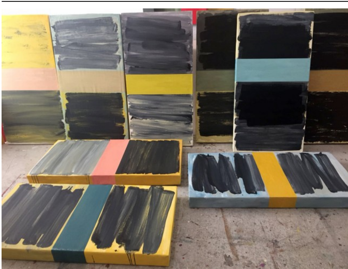
Algunes de les obres de l'exposició «Des del Groc» de Marià Dinarès

Marià Dinarès (Vic, 1959) és un artista visual que en la seva trajectòria ha combinat la pràctica artística i la docència, sobretot a l'Escola d'Art i Superior de Disseny de Vic, i que compagina amb l'impuls i la gestió de l'art contemporani. La seva obra parteix de la pintura, i més concretament d'una part d'aquesta com és el color i l'espai. També ha fet incursions en l'espai escènic i en el terreny de l'art sonor i performatiu. Ha mostrat la seva obra en diferents exposicions i participat en diversos esdeveniments artístics tant a Catalunya com a fora.