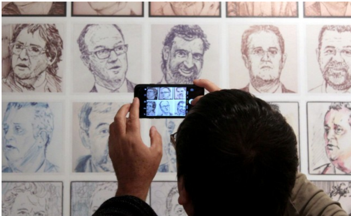
Un visitant de l'exposició fotografia l'obra de Quim Moya durant la inauguració, aquest dissabte

Quim Moya ( https://quimmoyalivepainting.wordpress.com/ ) (Barcelona, 1975) és un artista visual i avantguardista que explora les possibilitats de les arts i la pintura i que va estudiar en diferents escoles catalanes d'art, amb especialitzacions en comunicació gràfica, disseny i multimèdia. És un dels cofundadors al 2006 de la Cía. Cándida amb la qual oferien espectacles de pintura en directe que des de 2012 realitza en solitari i que ha portat a ciutats de l'Estat espanyol i països com França, Alemanya, Portugal, Suïssa, el Marroc, Kuwait, Índia, Qatar, Tailàndia, Sudàfrica, Estats Units, etc. A l'actualitat codirigeix el centre de producció cultural i residència d'artistes Cal Gras, situat a Avinyó, al Bages.