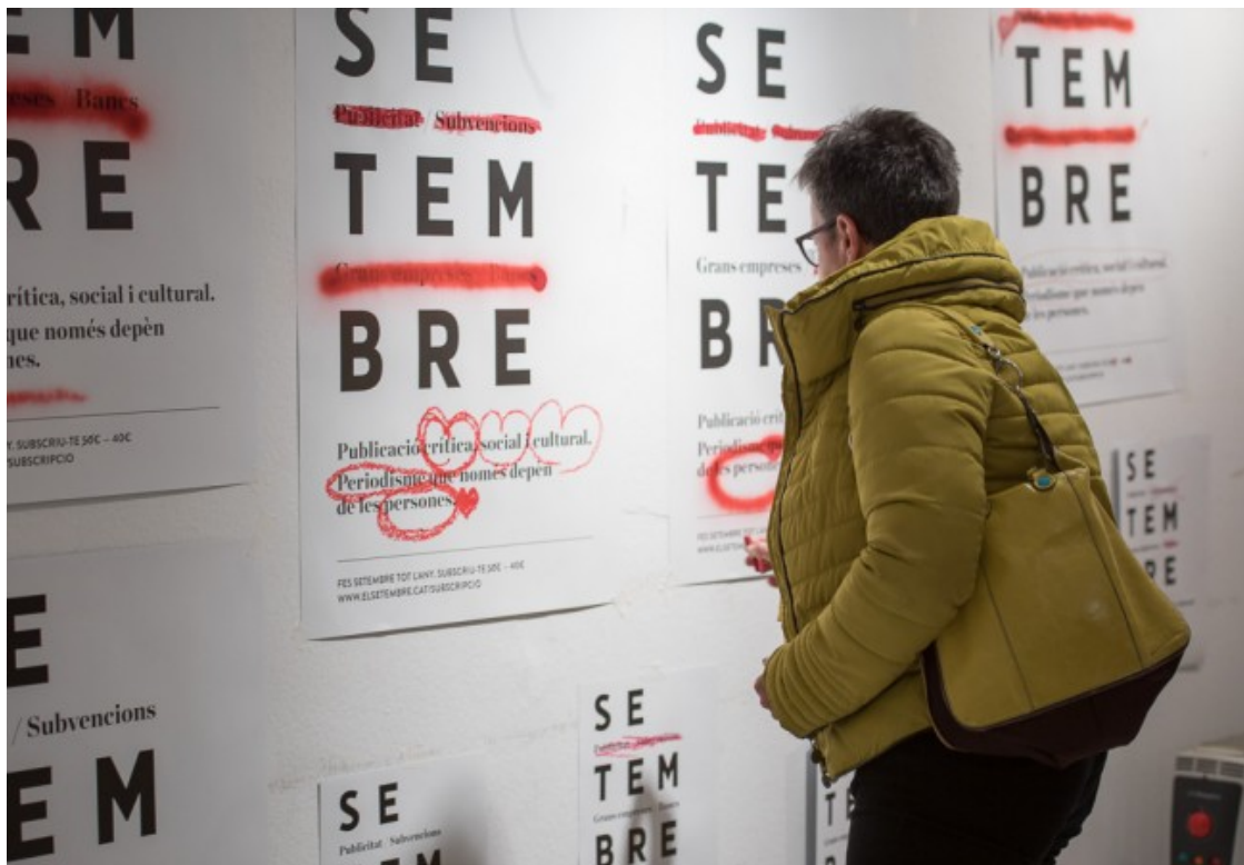
Les persones que van assistir a la festa van poder participar en l'elaboració dels cartells de la nova campanya de Setembre

La festa també va servir per donar el tret de sortida a la campanya de guerrilla que Setembre ha fet amb l'estudi creatiu Partee ( http://partee.cat/ ), que van habilitar la sala d'exposicions de l'Espai ETC per recordar que Setembre no depèn ni de grans empreses, ni de bancs, ni de subvencions, ni de publicitats. Que només depèn de les persones que li donen suport. El públic va poder participar a la campanya pintant els cartells amb diversos materials vermells: pintura, esprai, retoladors, pintallavis, ceres, pintaungles, etc, després de veure el vídeo d'arrencada de la campanya fet per Natx.tv ( http://natx.tv/ ). La campanya continuarà en tots els actes en els quals participi Setembre i també es repetirà als carrers de Vic durant la Diada de Sant Jordi. Des de Setembre es convida a participar-hi i a compartir-ho a les xarxes amb el hashtag #JoSetembre.