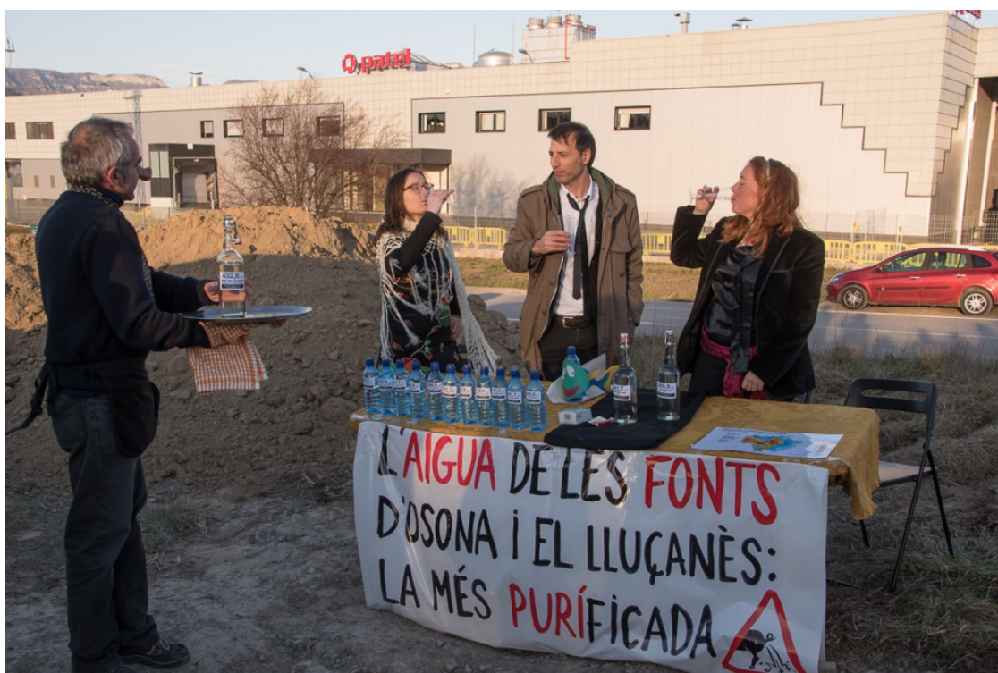
Acció teatralitzada del GDT durant la presentació dels resultats de les anàlisis, ahir davant de l'escorxador Patel

Segons el mostreig anual realitzat pel Grup de Defensa del Ter, la concentració de nitrats a les fonts osonenques i del Lluçanès ha augmentat, passant de 57 a 64 mg/l de mitjana | La Font de Gallisans de Santa Cecília de Voltregà segueix sent la més contaminada amb un valor de 432,6 mg/l. El límit establert per la Unió Europea és de 50 mg/l