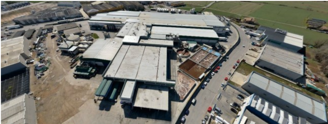
Vista aèria de l'escorxador Le Porc Gourmet de Santa Eugènia de Berga