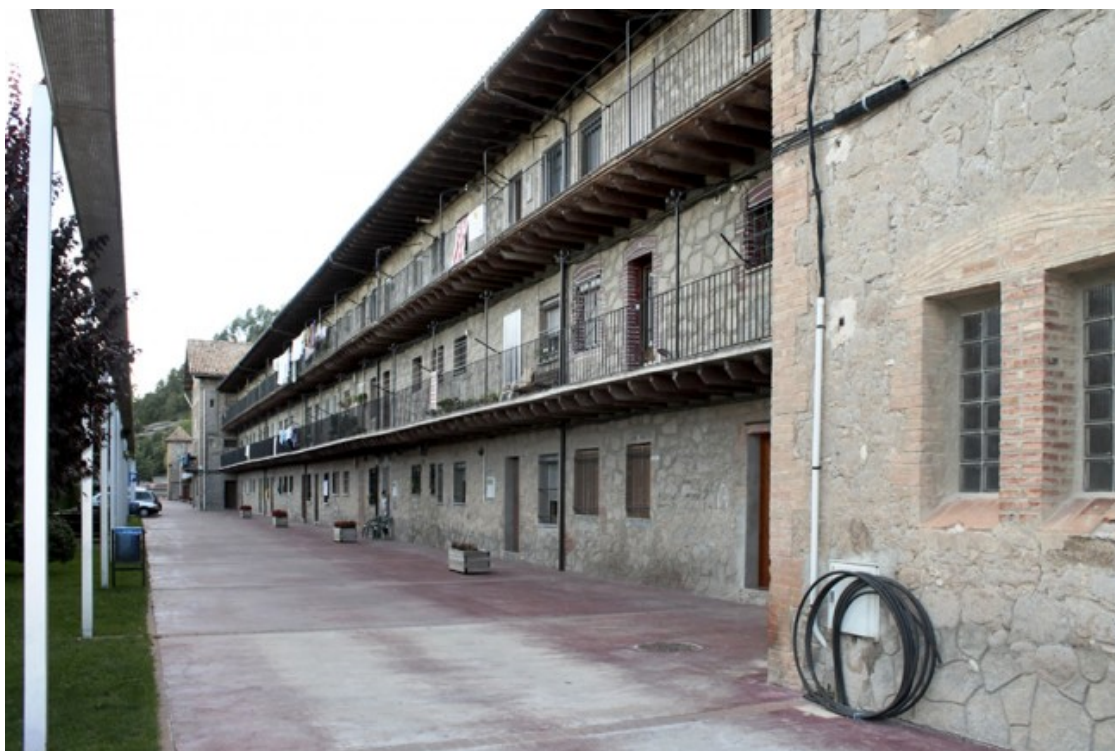
Imatge actual de la colònia industrial berguedana, assaltada per un escamot llibertari fa 69 anys. La colònia de la Plana va ser una de les més importants del Berguedà