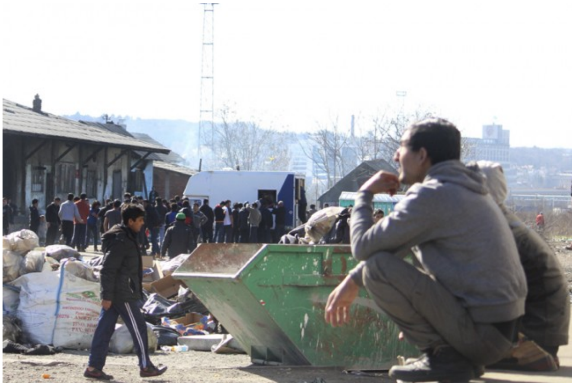
Barraques abandonades de Belgrad, on vivien cap a 1.000 refugiats joves en condicions d'extrema precarietat

vintena de camps d'internament repartits arreu. Tanmateix, en opinió de diverses treballadores que fan feina sobre el terreny amb l'organització humanitària Initiative for Development and Cooperation (IDC), hi hauria també cap a un miler de persones que deambulen pel país sense estar sotmeses a cap registre estatal.