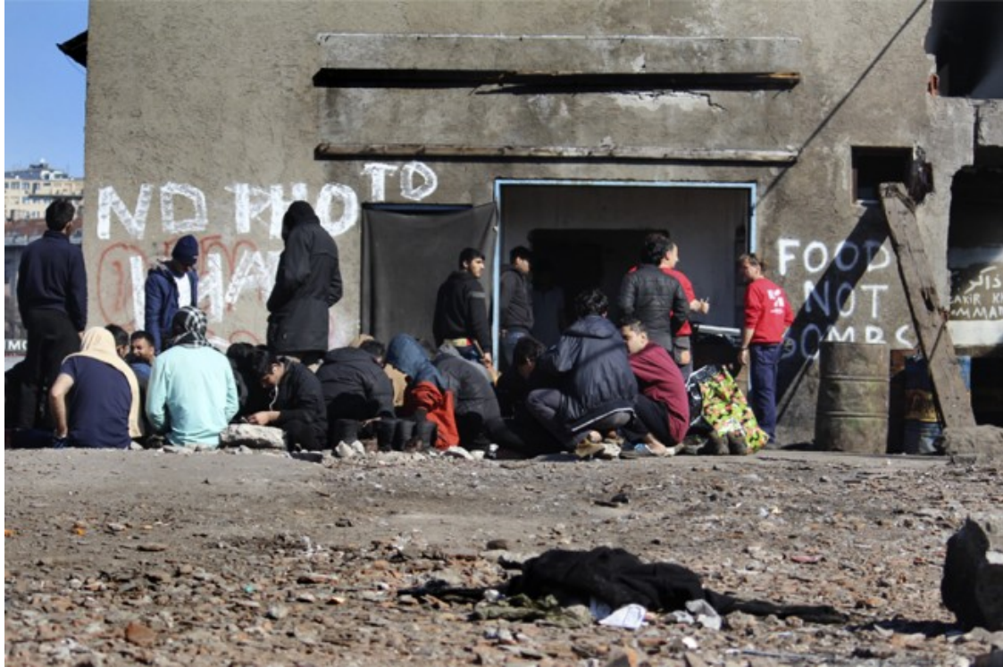
Refugiats a les barraques de Belgrad

endinsar-s'hi, estaran altra vegada a un país de la Unió Europea, però això no els garanteix cap permanència.