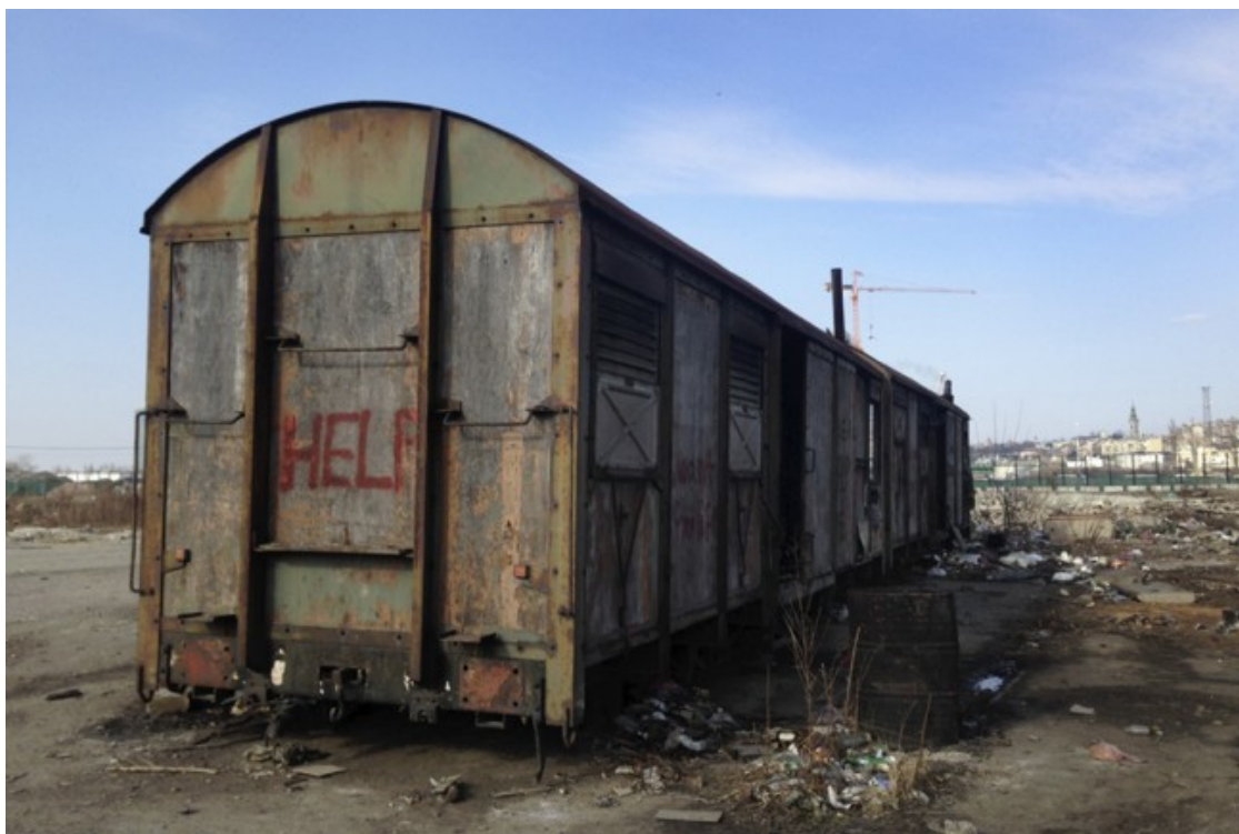
Vagó antic al voltant de les barraques de Belgrad on vivien refugiats

Al nord de Sèrbia, el territori està ple de camps de tonalitat verda i dimensions extenses. A hores d'ara, en temporada d'estiu, moltes refugiades en trànsit dormen entre cultius mentre esperen el moment per fer el salt a Croàcia. Sid, un municipi ben comunicat a prop del límit fronterer, és un dels punts calents que molts refugiats utilitzen per accedir al país veí. No obstant, la quantitat de gent que aconsegueix esmunyir-se per Croàcia és cada cop més reduïda. «La frontera està plena de sensors i els controls de policia són cada cop més rigurosos: ara també patrullen amb gossos», comenten fonts internes de l'organització humanitària Initiative for Development and Cooperation (IDC). Segons Bruno Alvarez, un voluntari espanyol que treballa sobre el terreny amb l'associació independent No Name Kitchen, «cada dia hi ha desenes de refugiats que creuen a Croàcia, però la majoria són interceptats pels cossos policials i retornats a territori serbi de males maneres».