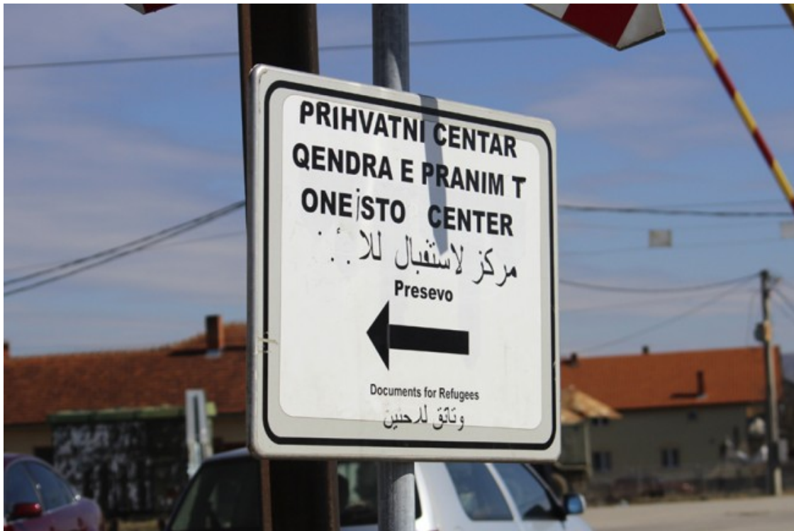
Indicacions per arribar al camp de refugiats de Preshevo, a l'extrem sud de Sèrbia