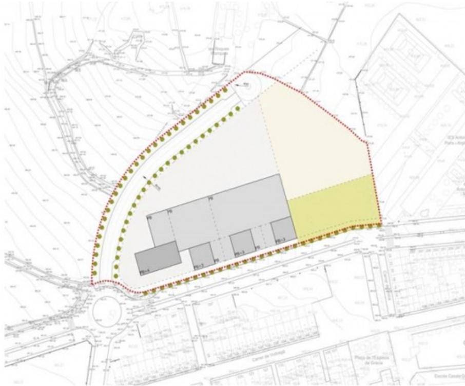
Alternativa 1 d'ordenació de l'àmbit del Poquí de Manlleu prevista a l'esborrany de la Modificació Puntual del Pla General d'Ordenació Urbana de Manlleu