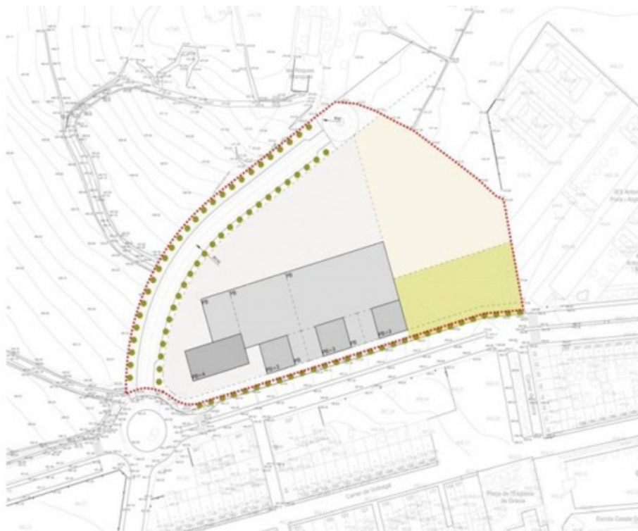
Alternativa 1 d'ordenació de l'àmbit del Poquí de Manlleu prevista a l'esborrany de la Modificació Puntual del Pla General d'Ordenació Urbana de Manlleu