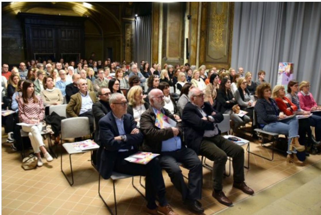
Públic assistent a la sessió de balanç de 2023 que el Consorci va fer al Paranif de la Universitat de Vic

necessaris per al seu plantejament, ja que es basen en la comptabilitat pressupostària». El CatSalut recorda que un cop aplicat el romanent de tresoreria dels dos exercicis anteriors, «el tancament en comptabilitat pressupostària ha quedat en equilibri».