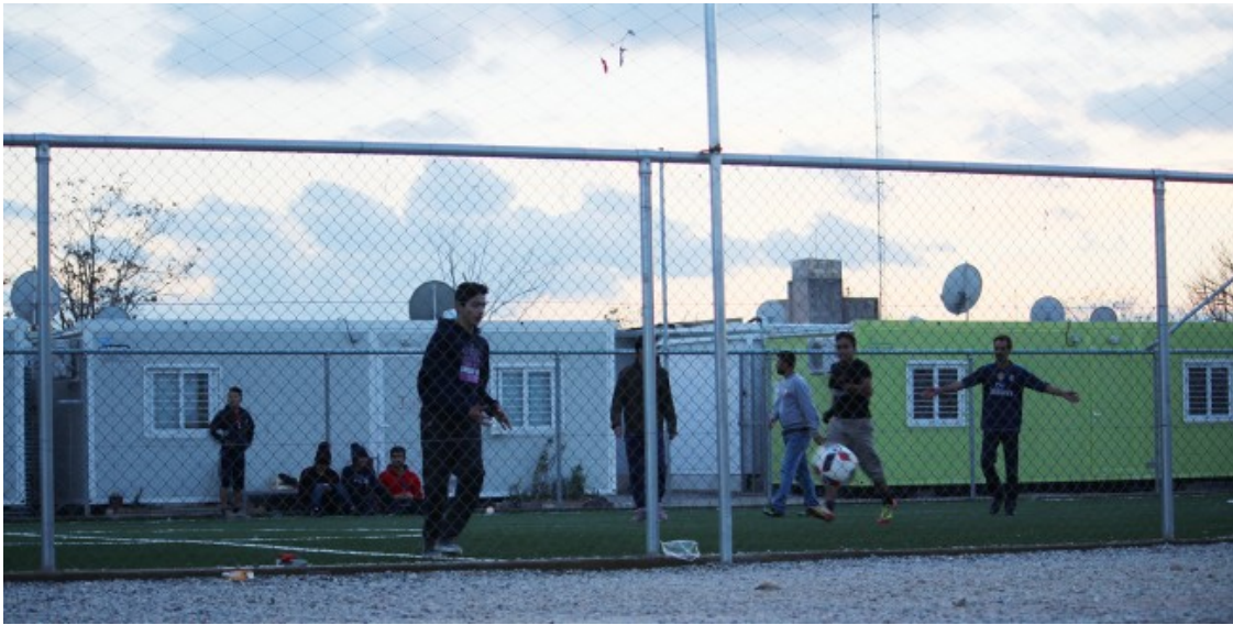
Refugiats joves juguen a futbol al camp d'Elaionas. La gent busca qualsevol activitat per matar el temps

Igual que en Malik, per a moltes refugiades, el procés fins a la resolució definitiva de la seva tramitació d'asil és un camí interminable que està ple d'esculls: la burocràcia grega és caòtica i els tràmits són confusos. En tot el camí, l'angoixa i la incertesa remou per dins a molts sol·licitants d'asil. Elaionas, a prop del centre d'Atenes, és un dels camps de refugiats on els nervis estan a flor de pell. Obert des de l'agost de 2015 per gestionar l'arribada massiva de persones refugiades, al recinte hi viuen 1.500 peticionaris de protecció internacional de més d'una vintena de nacionalitats diferents que estan repartits en files de barracons metàl·lics. Tanmateix, la permanència a Europa de molts dels residents penja d'un fil. «Fins ara, l'Estat grec ha rebutjat la majoria de peticions de refugi de la gent que som de l'Àfrica subsahariana», explica un noi de Costa d'Ivori que prefereix no revelar la seva identitat perquè es troba en una situació legal molt incerta.