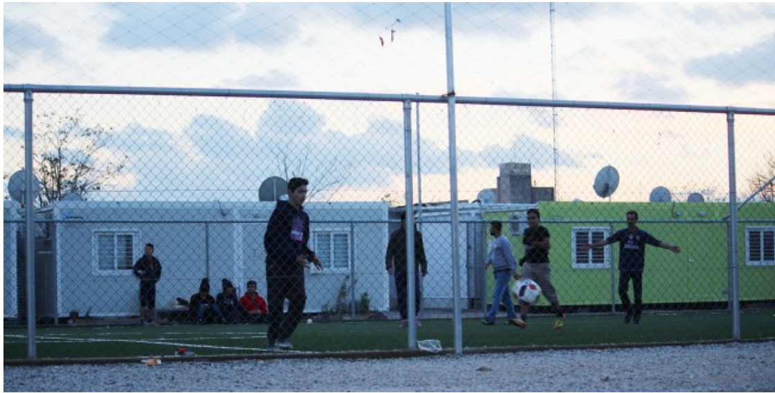
Refugiats joves juguen a futbol al camp d'Elaionas. La gent busca qualsevol activitat per matar el temps

Igual que en Malik, per a moltes refugiades, el procés fins a la resolució definitiva de la seva tramitació d'asil és un camí interminable que està ple d'esculls: la burocràcia grega és caòtica i els tràmits són confusos. En tot el camí, l'angoixa i la incertesa remou per dins a molts sol·licitants d'asil. Elaionas, a prop del centre d'Atenes, és un dels camps de refugiats on els nervis estan a flor de pell. Obert des de l'agost de 2015 per gestionar l'arribada massiva de persones refugiades, al recinte hi viuen 1.500 peticionaris de protecció internacional de més d'una vintena de nacionalitats diferents que estan repartits en files de barracons metàl·lics. Tanmateix, la permanència a Europa de molts dels residents penja d'un fil. «Fins ara, l'Estat grec ha rebutjat la majoria de peticions de refugi de la gent que som de l'Àfrica subsahariana», explica un noi de Costa d'Ivori que prefereix no revelar la seva identitat perquè es troba en una situació legal molt incerta.