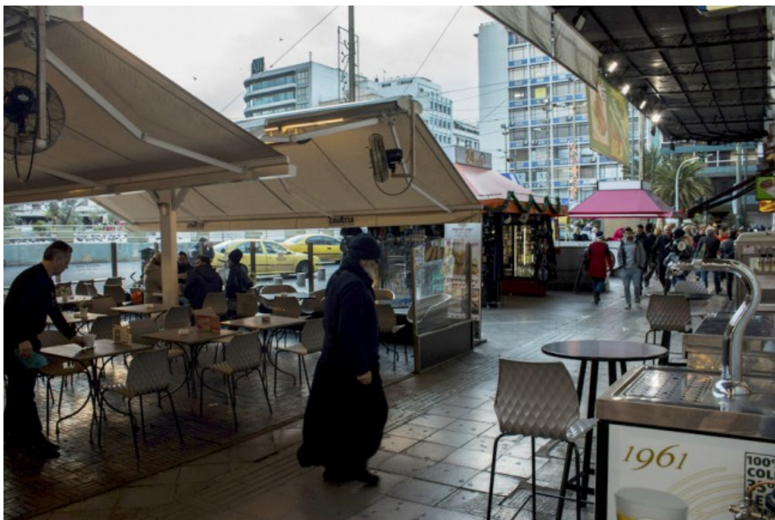
Terrasses a la Plaça d'Omonoia, un dels punts neuràlgics de la ciutat d'Atenes

A Grècia, les problemàtiques s'acumulen i s'engreixen en una dinàmica de cercle viciós. Els darrers anys, amb l'encallament al país de milers de refugiats, la Plaça d'Omonoia també s'ha convertit en un espai de trobada per a molts sol·licitants d'asil. Sense possibilitats d'arribar al nord d'Europa, la gent refugiada és víctima del procés de burocratització del continent. En la seva ruta de fugida, Grècia només era una parada a mig camí, però el tancament de les fronteres europees va causar que més de 60.000 persones quedessin encallades en condicions deplorables a un país en estat de xoc econòmic. Algunes de les novingudes estan en procés de ser relocalitzades a un altre país membre de la UE a través dels programes de reubicació o de reunificació familiar, però són una minoria. Un any després de l'acord entre la Unió Europea i Turquia, la majoria de refugiades s'han de resignar a demanar asil a l'Estat grec si no volen ser expulsades. No obstant, l'acollida no és per a tothom: segons estableixen els criteris de la UE, els refugiats de nacionalitats com Síria o Eritrea són els únics que accedeixen al dret d'asil després de passar per un procediment burocràtic que va a pas de tortuga i funciona malament.