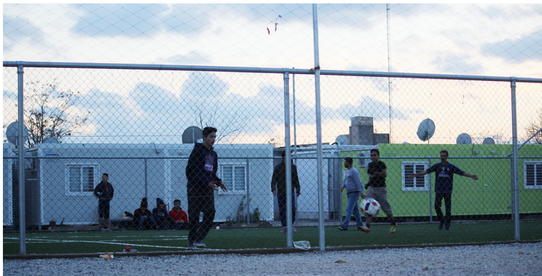
Infants refugiades juguen al camp d'Elaionas. Moltes de les persones que hi ha encallades són de nacionalitat afganesa i subsahariana | Joan Mas

El periodista Joan Mas dóna veu des d'Atenes a persones refugiades de diferents nacionalitats que no aconseguen sortir de Grècia cap a una Europa cada vegada més bunqueritzada | El relat hegemònic ha centrat la qüestió de les persones que busquen refugi en l'èxode sirianà, però les desplaçades que s'acumulen a Europa són d'una gran diversitat de llocs que arrossegueu guerres invisibilitzades des de fa temps