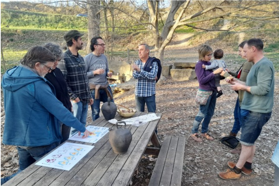
La presentació del resultat de les analítiques de les fonts va acabar amb un berenar a la Font Trobada