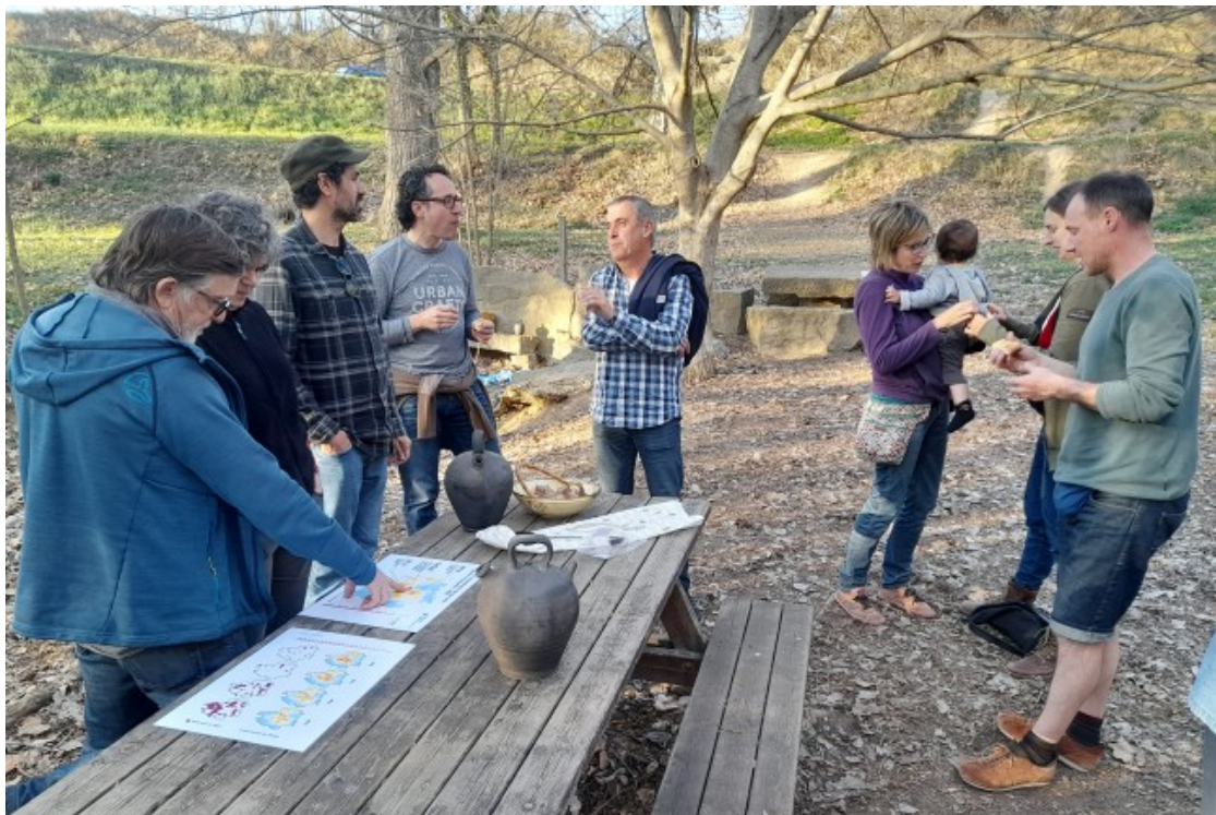
La presentació del resultat de les analítiques de les fonts va acabar amb un berenar a la Font Trobada