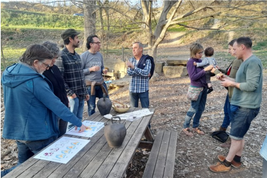
La presentació del resultat de les analítiques de les fonts va acabar amb un berenar a la Font Trobada