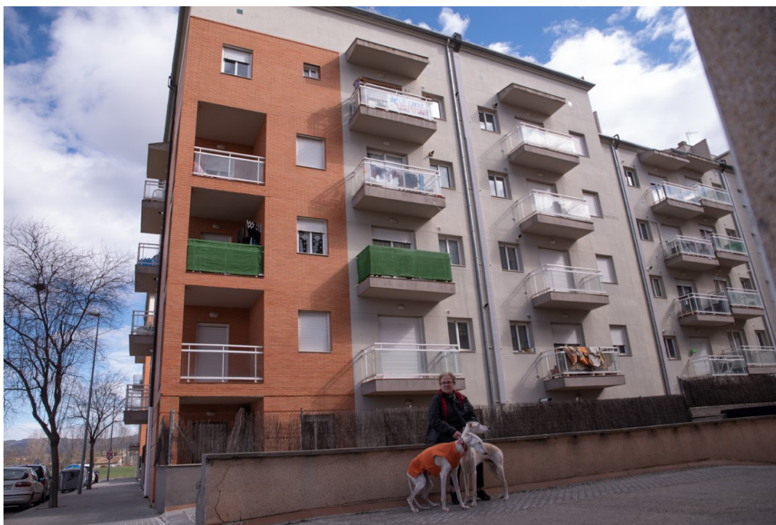
Montse Martínez davant de l'edifici on viu a Vic | Dolors Pena

El veïnat de catorze de les 37 promocions d'habitatge de protecció oficial de l'entitat financera llança la campanya «Destapem La Caixa» per reivindicar una negociació col·lectiva i la consolidació d'un parc protegit de lloguer | Una de les promocions afectades és una amb 112 habitatges al barri d'Osona de Vic