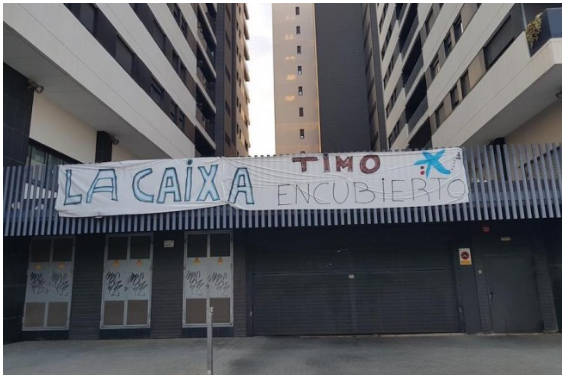
Pancartes a la promoció de la Carretera de Collblanc de l'Hospitalet de Llobregat

A més de problemes de construcció, es queixa d'un mal manteniment: «hi ha humitats i goteres als edificis». No és l'única promoció de la Fundació la Caixa en aquesta situació. Des d'altres promocions constaten que la propietat no es fa càrrec del manteniment, que les zones comunes estan abandonades i que els materials utilitzats són de baixa qualitat. Un altre bloc de l'Hospitalet, a l'avinguda Carrilet, ja havia denunciat problemes de manteniment des que hi van entrar a viure. Van començar a pagar manteniment de plaques solars sense que funcionessin, incidents a les calderes o ascensors espatlats.