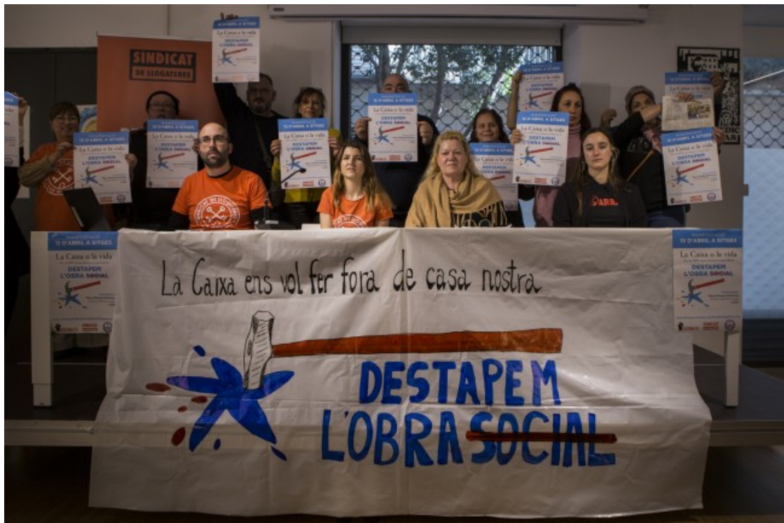
Roda de premsa per presentar la campanya «Destapem la Caixa» amb una afectada, el Sindicat de Llogateres i l'Assemblea pels Drets Socials del Garraf

A través d'un informe presentat a la roda de premsa, el Sindicat de Llogateres exposa les subvencions directes, cessions de terrenys, beneficis fiscals i subsidis als préstecs que ha rebut la Caixa per a la construcció del parc de protecció oficial de lloguer. Després de fer uns càlculs, conclouen que diferents promocions, com Salou i Cornellà, ja estan amortitzades i que, per tant, no existeix cap raó econòmica que justifiqui la no renovació dels lloguers un cop acabada la protecció. De fet, Inmo Criteriacaixa, presidida per Isidro Fainé Casas, va obtenir un benefici net de 2.599 milions d'euros el 2021.