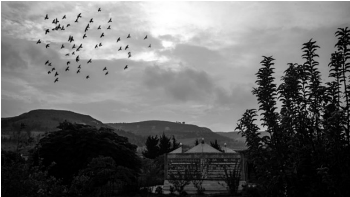
«El terra tremola, la porta es sacseja, ha caigut el tercer míssil. Sento el meu nom, reaccio, recullo les coses essencials en una motxilla petita.»