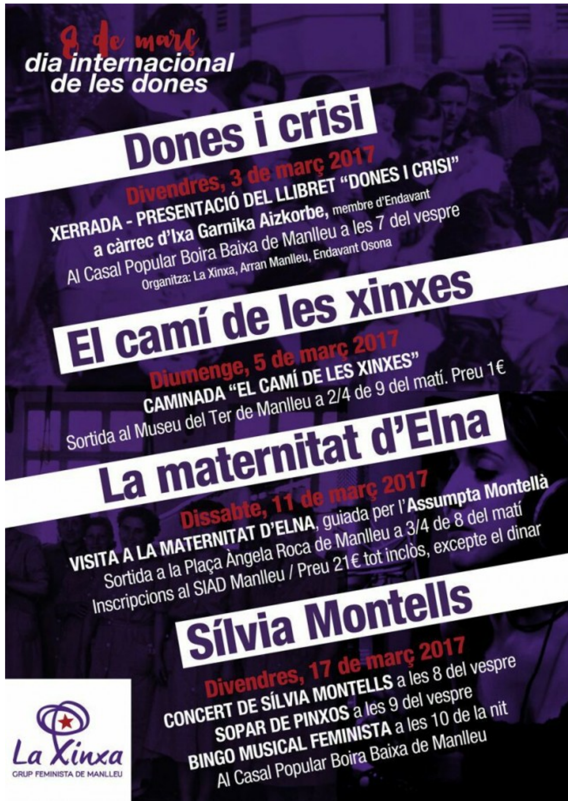
Cartell dels actes de la Xinxa Feminista per aquest 8-M