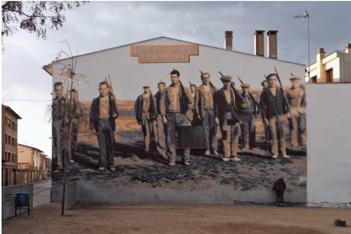
Calldetenes ja és al mapa i pròximament s'hi afegiran indrets com Gironella, l'Escala, Manresa, Tortosa o Falset.