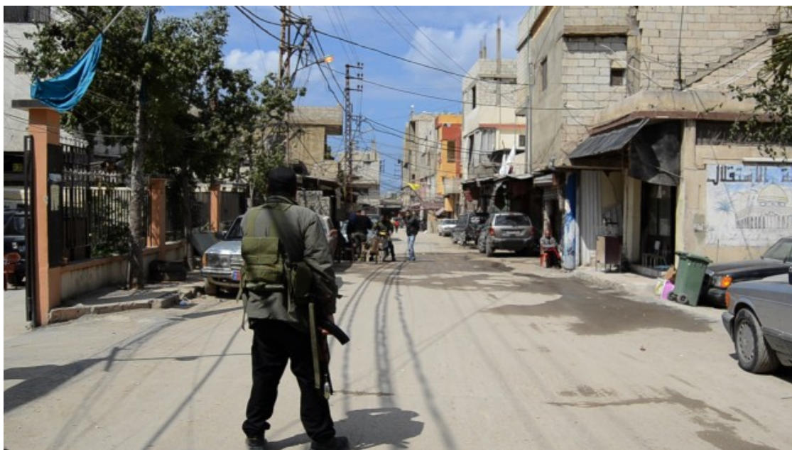
Homes armats al camp Ein El Hilweh