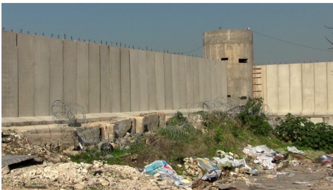
Nou mur en construcció a Ein El Hilweh