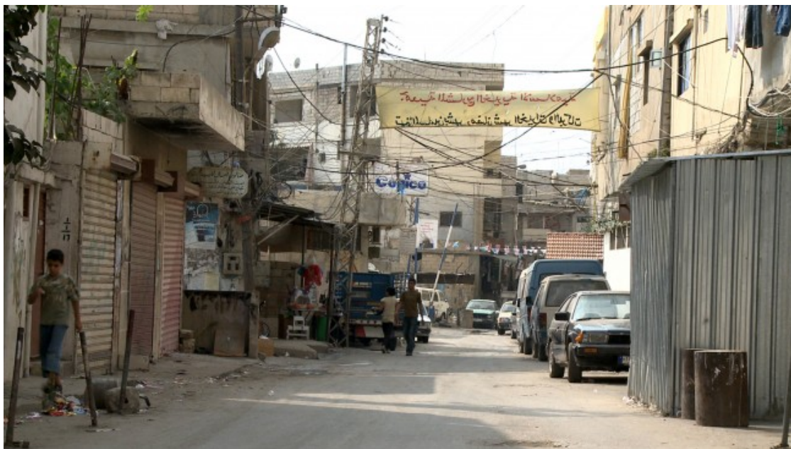
Camp de refugiats Ein El Hilweh

A mitjans de 1949 les Nacions Unides van crear la UNRWA (United Nations Relief and Works Agency for Palestine Refugees in the Near East) per assistir a les persones refugiades palestines i proporcionar-los educació, atenció sanitària, serveis socials... Els seus camps, establerts com a temporals, van acabar essent permanents, tot i que les Nacions Unides els hi reconeguessin el seu dret al retorn, a través de la resolució 194. El text resol que «les persones refugiades palestines que desitgin tornar a les seves cases i viure en pau amb els seus veïns i veïnes, han de ser autoritzades a fer-ho el més aviat possible, i s'ha de pagar una compensació a les que decideixin no tornar, així com a les que van patir danys o pèrdues de les seves propietats». Israel mai ha reconegut aquesta decisió i no ha mogut ni un dit per a la seva aplicació.