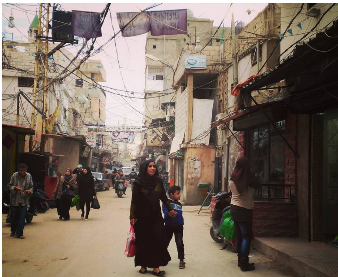
Camp de persones refugiades palestines Ein El Hilweh, al Líban

Laura Arau explica, una setmana després de tornar del camp Ein El Hilweh, com la població palestina refugiada al Líban continua patint la discriminació institucional i la vulneració dels drets humans | A semblança dels murs que separen a Cisjordània i Gaza de la resta de la Palestina ocupada, el Líban està construint un mur al voltant del camp Ein El Hilweh