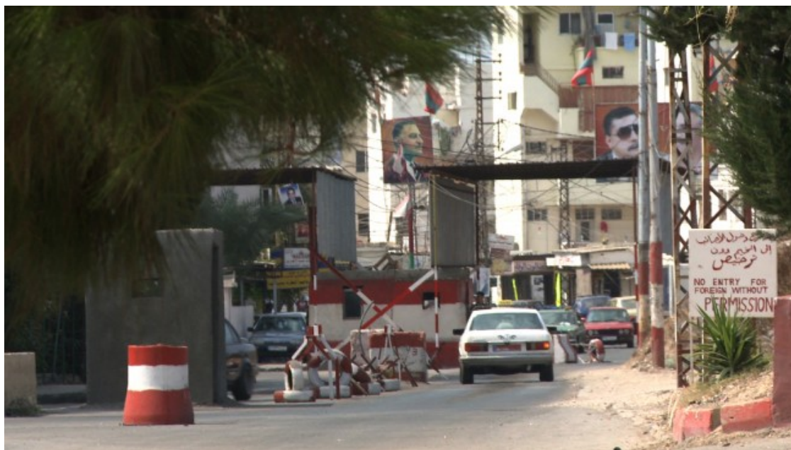
Punt de control a l'entrada del camp Ein El Hilweh

Actualment, el Líban acull a unes 470.000 persones refugiades de Palestina (un 10% del total de la seva població) repartides en 12 camps oficials. Alguns d'ells estan rodejats de parets de formigó armat i controlats per militars libanesos. Les pressions sobre aquests camps augmenten cada vegada més, convertint-los en guetos i transformant-los en els nous camps de concentració del segle XXI.