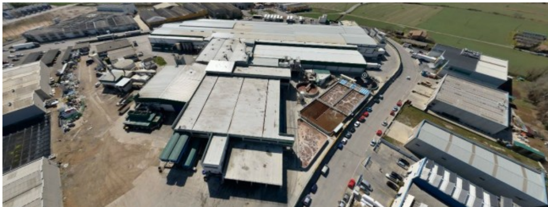
Vista aèria de l'escorxador Le Porc Gourmet de Santa Eugènia de Berga