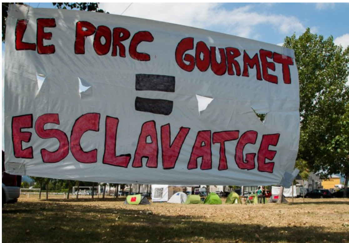
Acampada a Le Porc Gourmet a Santa Eugènia de Berga

producció. En concret, un a la zona de degollament, dos a la d'extracció de budells, i un a la bàscula. Punts claus, segons els responsables de Le Porc Gourmet, en la cadena de producció i que, sense la participació dels quatre denunciants, va haver d'estar aturada fins a cinc hores. I els 1.903 porcs amb els quals no es va poder completar la cadena es van haver de llençar, segons consta també en la documentació aportada per l'empresa al jutjat.