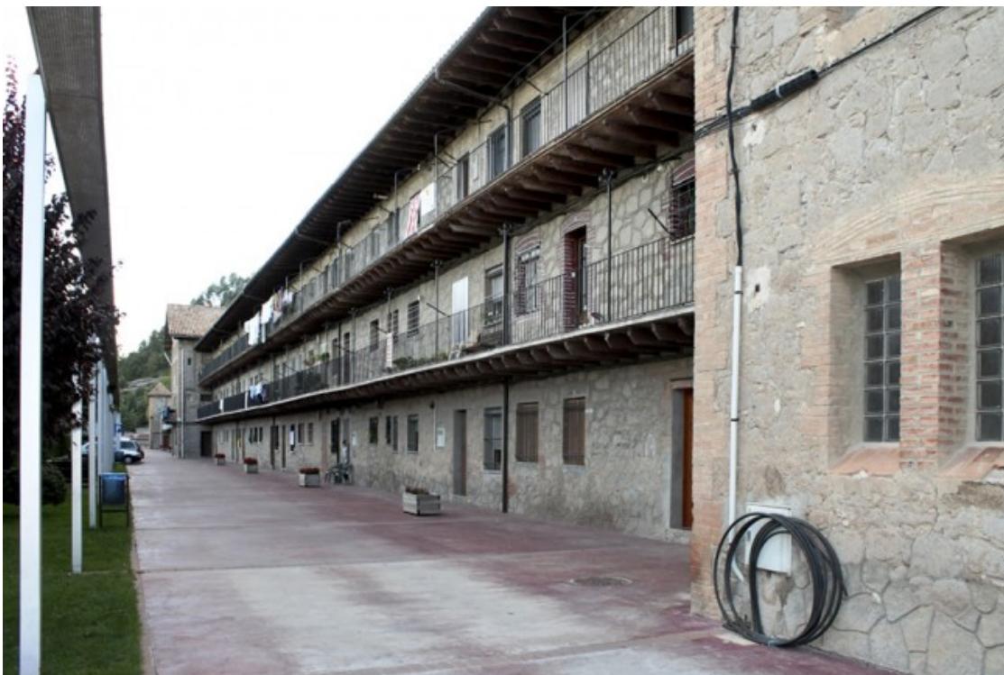
Imatge actual de la colònia industrial berguedana, assaltada per un escamot llibertari fa 69 anys. La colònia de la Plana va ser una de les més importants del Berguedà