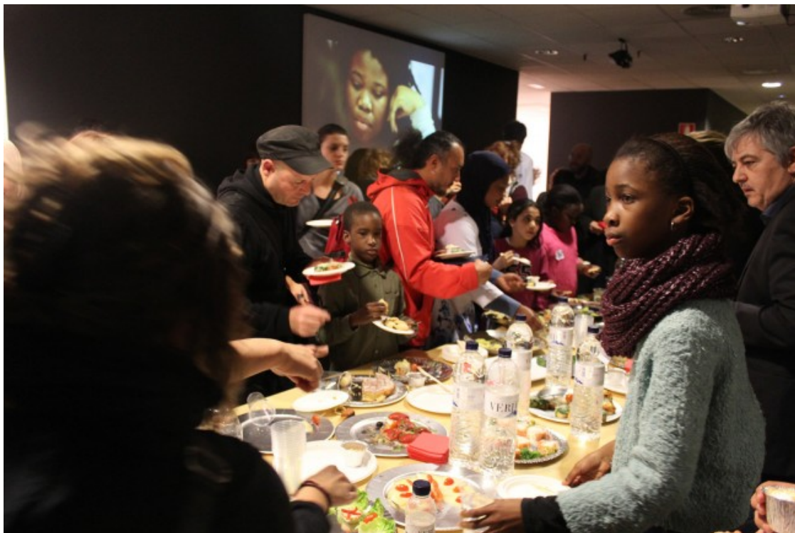
Un moment de la inauguració de l'exposició

enriquir elements identitaris i culturals; potenciar el treball en equip i les relacions interpersonals; elaborar un projecte artístic entre diverses persones que formen part de comunitats locals; i generar treballs interdisciplinaris entre artistes locals i estrangers.